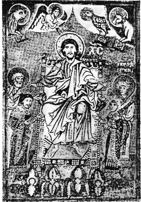
Христосъ коронуетъ Ярополка, князя Волынскаго и Галицкаго, съ его женою (изъ молитвенника его матери).

равы (1064 г.). Нѣкоторое время Галичина находится въ рукахъ Волынскаго Ярополка Изяславича; но ок. 1087 г., послѣ неоднократныхъ и настойчивыхъ попытокъ добыть себѣ удѣлъ, ее получаютъ Рюрикъ, Володаръ и Василько Ростиславичи. Съ этого времени, собственно, и начинается исторія Галичины, какъ отдѣльнаго княжества.