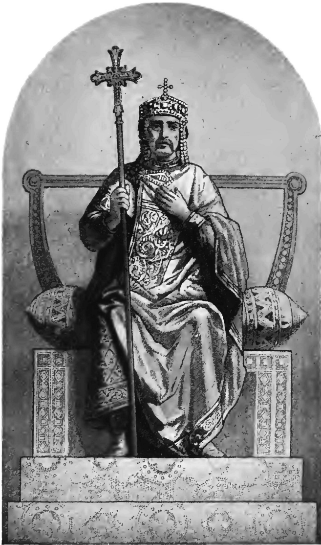
Кіевскій князь Владиміръ Святой.