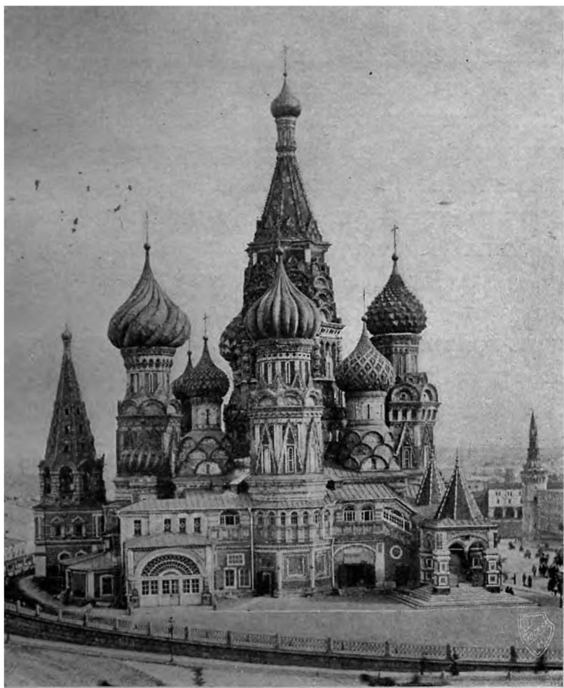
Московскій соборный храмъ Покрова пресв. Богородицы (Василій Блаженный) съ сѣверной стороны.