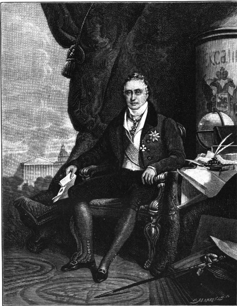
ГЕНЕРАЛЪ-АДЪЮТАНТЪ КАРЛЪ ОСИПОВИЧЪ ГРАФЪ ПОЦЦО-ДИ-БОРГО.