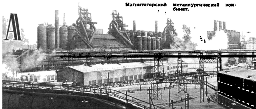
Магнитогорский металлургический комбинат.