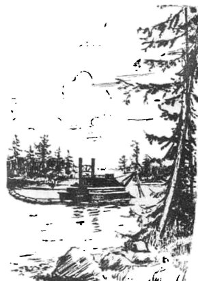
Рисунок И. Михайлина.