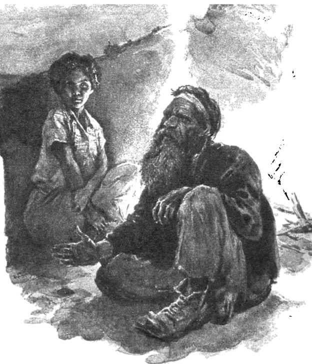
Рисунки Ю. Ракутина.