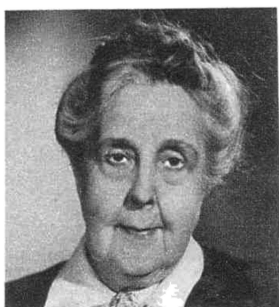
Народная артистка СССР А. А. Яблочкина.

Недавно общественность отметила 70-летие сценической деятельности этой замечательной артистки, отдающей любимому искусству весь свой большой талант.