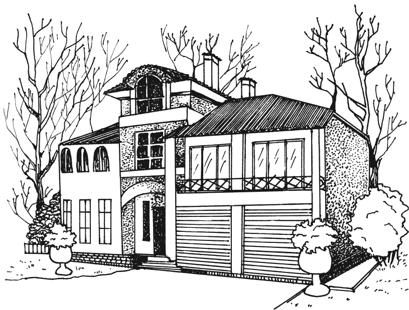
Рисунок 1. Спаренный встроенный гараж

Если площадь коттеджа превосходит 400 м 2 , то сооружают спаренный гараж на 2 автомашины. Такой гараж обычно делают с 2 воротами, так как спаренный гараж с 1 воротами неудобен в использовании (рис. 1).