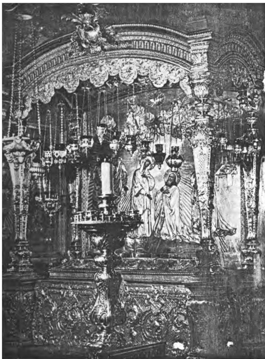
Рака Святых мощей Преп. Сергия Радонежского.