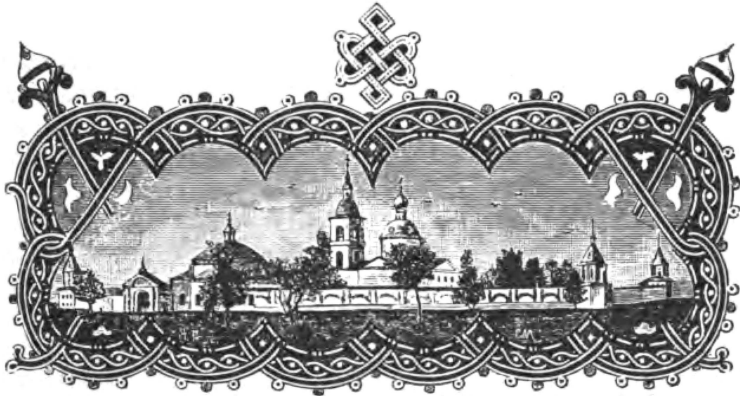
Ростовскій Троицкій Варницкій монастырь.