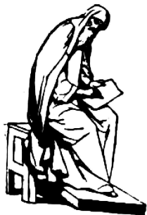
Преподобный Епифаній Премудрый.

„СЛАВА БОГУ о всемъ и всяческихъ ради! Слава показавшему намъ житіє мужа свѣта и старца духовна, — благодаримъ Бога за премногую Его благость, бывшую на насъ, яко дарова намъ свѣта старца, господина Преподобнаго Сергія, въ землѣ нашей Рускѣй, въ странѣ полунощнѣй“. Такъ начинается свое сказаніе о житїи и подвигахъ Преподобнаго отца нашего Сергія, его присный ученикъ, блаженный Епифанїй. „Дивлюся же“, говоритъ онъ, „како только лѣтъ минуло а житіє свѣтаго старца не писано было; и о семъ скажѣмъ зѣло, како убо таковый свѣтый старецъ пречудный и предобный, отгелѣже представися 26 лѣтъ прѣйде, и никто не дерзаяше писати о немъ, ни дальнїй, ни ближнїй, ни большїй, ни меньшїй“.