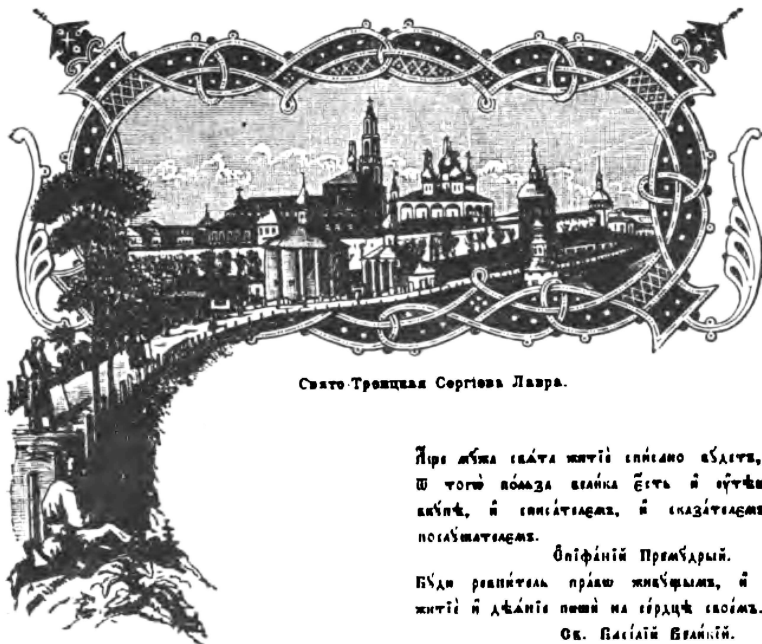
Свято-Троицкая Сергиева Лавра.

Нера жбука свѣта житіє сплісно абдіте, что ш того помага вѣлика єсть и зучѣшеніє вѣбчѣ, и свѣтлѣдемь, и сказѣдемь, и послѣмѣдемь.