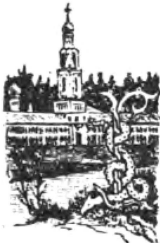
Пещеры Геосмавскаго свята.

Радуйся въ чреве матерна бжеаринный, Радуйся въ рождѣніи твоёмъ сімомахъ радости наречинный. Акад. ѿ, І. к. ѿ. Радуйся, блго прѣдѣ рождѣніа пригласинемъ прославиный СВѣтѣ Трѣхъ. І. к. Жиннѣ. Радуйся, пречдѣносъ въ младѣнствѣхъ вѣст. ижечеио ижеже акадѣй. Акад. ѿ, І. к. ѿ.