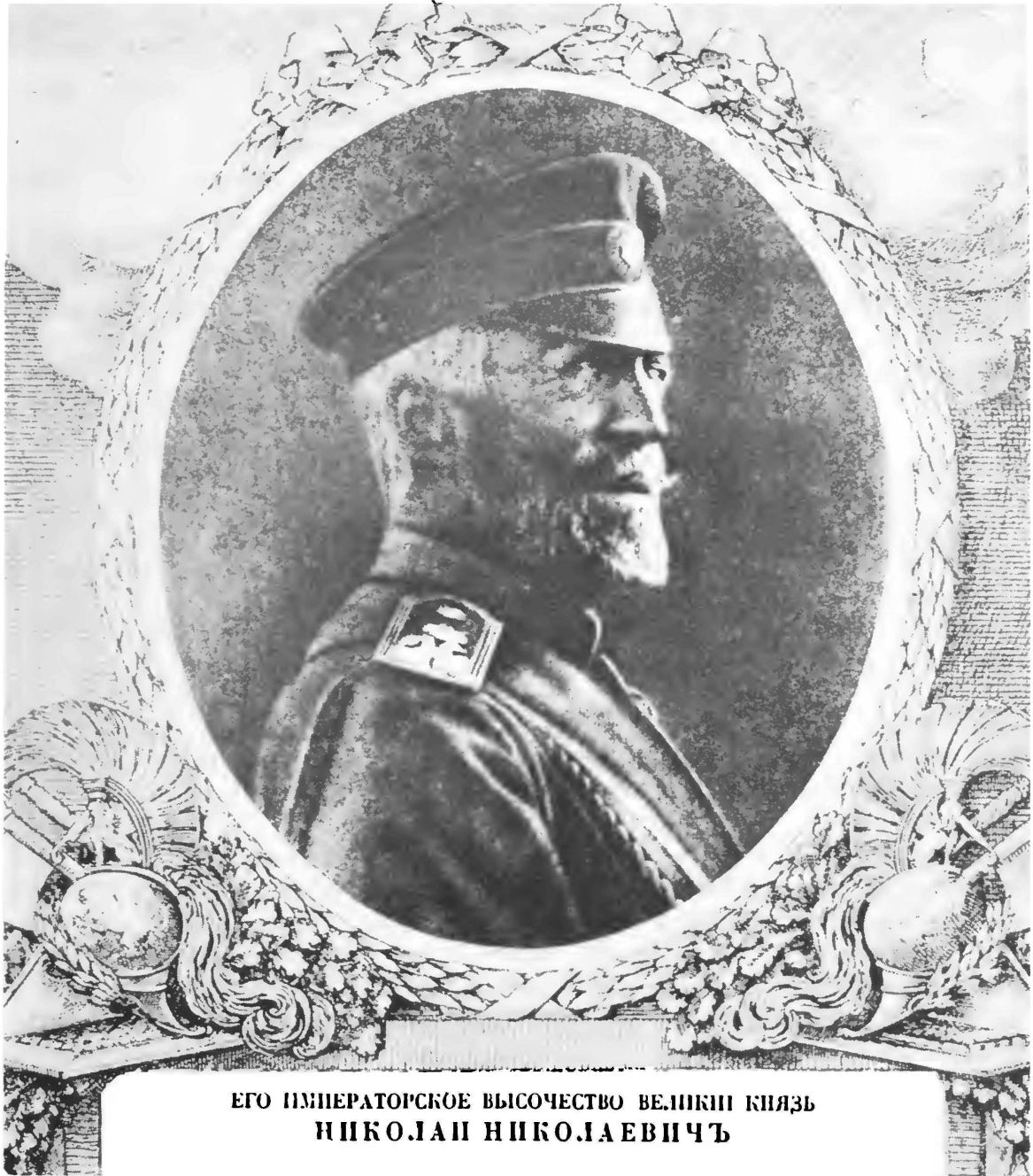
ЕГО ИМПЕРАТОРСКОЕ ВЫСОЧЕСТВО ВЕЛИКИЙ КНЯЗЬ НИКОЛАИ НИКОЛАЕВИЧЪ