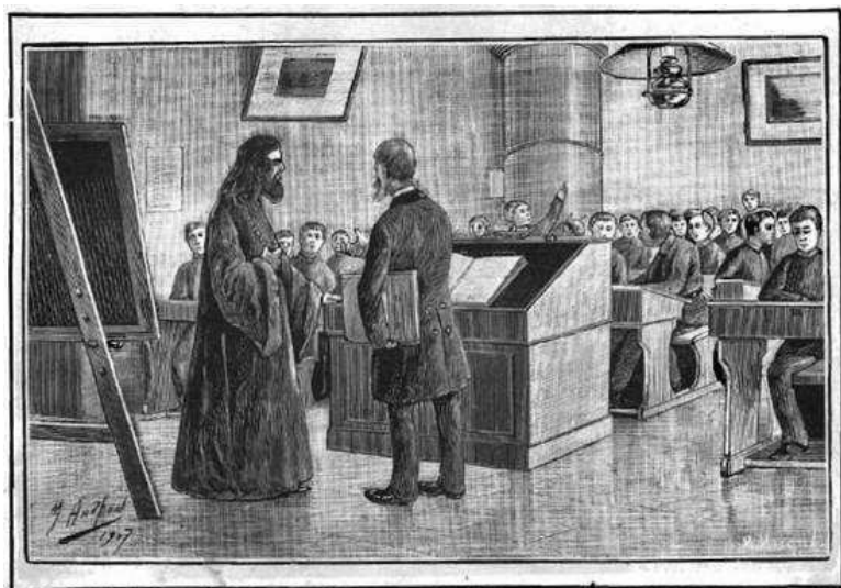
Дверь широко распахнулась и въ классъ Аріавъ пулей влетѣлъ Луканья. (Къ стр. 9).