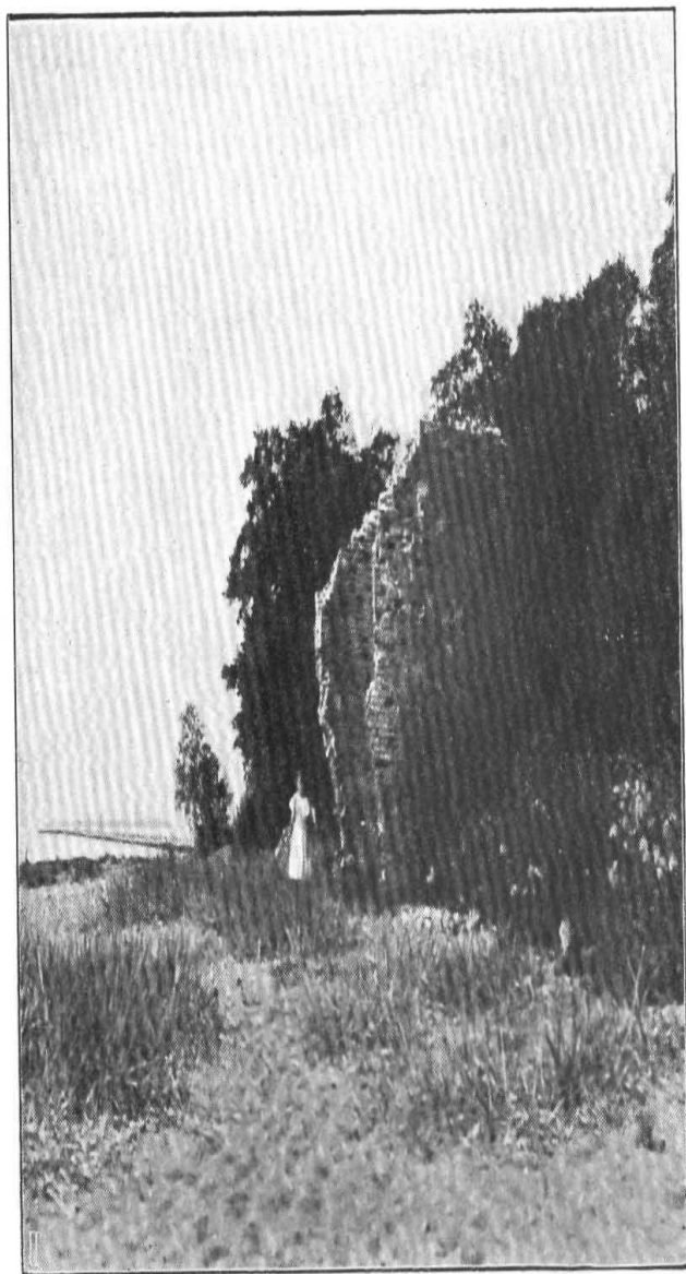
Остатки вышекъ для наблюденія Петромъ I за непріятельскимъ флотомъ.