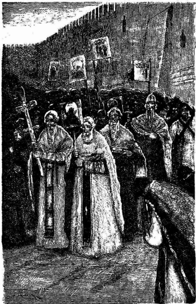
Крестный ходъ въ Царьградѣ.