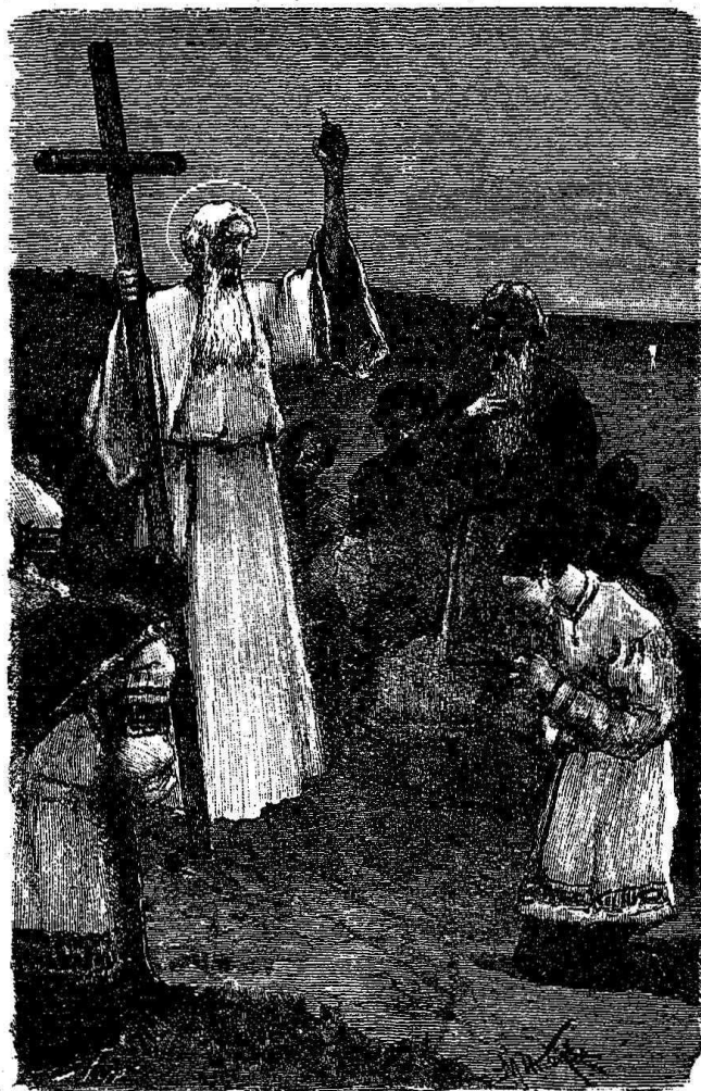
Св. апостоль Андрей Первозванный на кievскихъ горахъ.