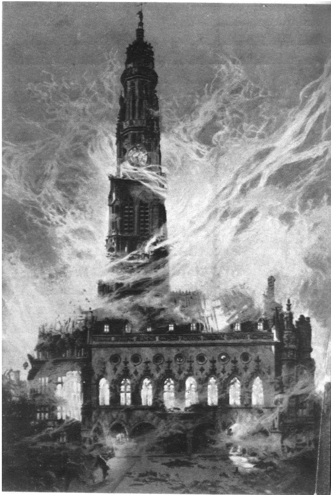
Пожаръ ратуши въ Аррасъ.