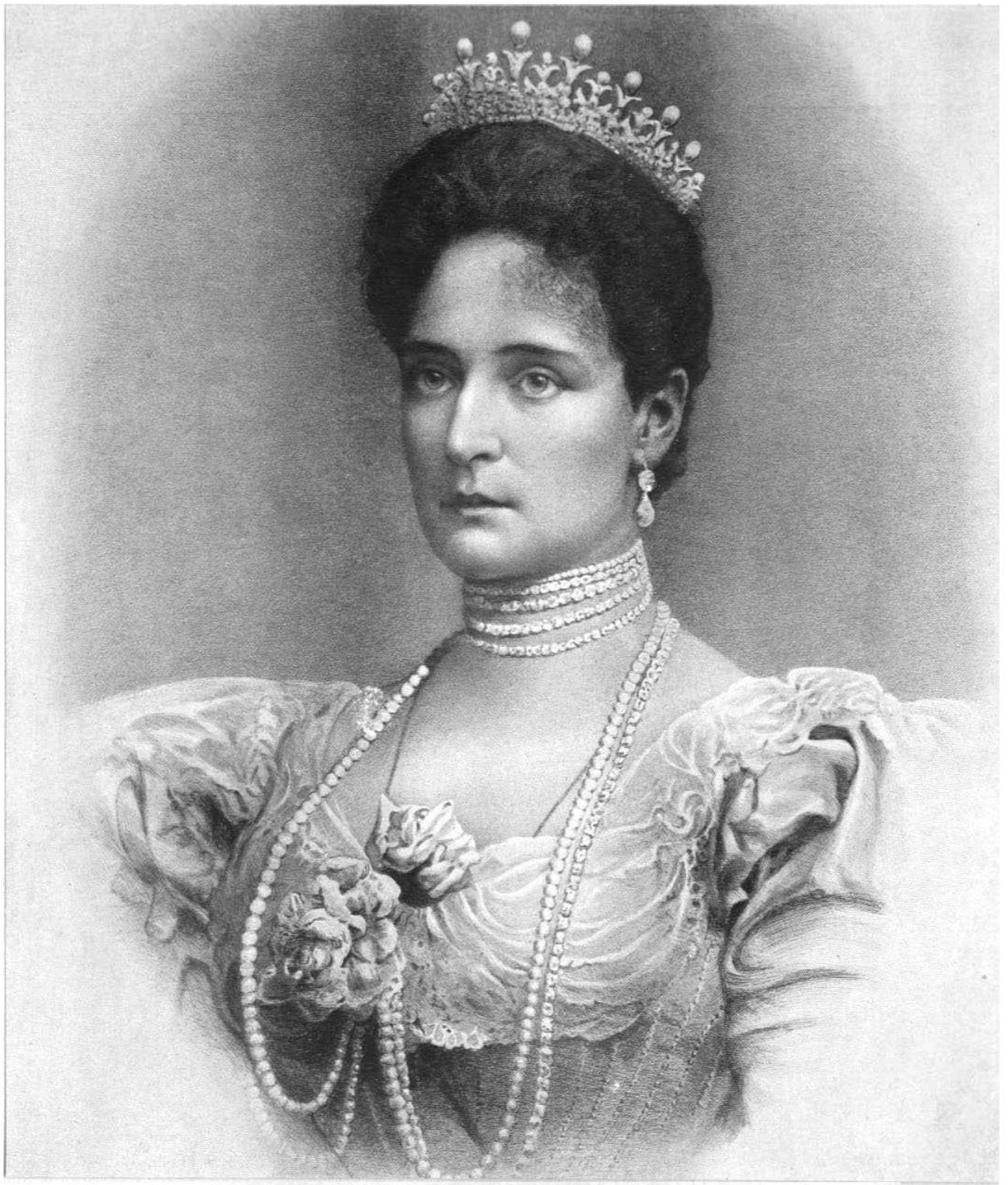
Ея Императорское Величество Государыня Императрица АЛЕКСАНДРА ФЕОДОРОВНА.