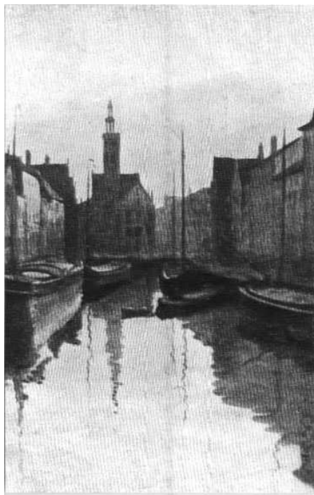
Брюгге. — Зеркальная набережная.

Мазурские озера, важная подготовленная оборонительная преграда германцев, в панике бросаются ими без обороны, и значительная доля этой богатейшей провинции Германии очищается ими.