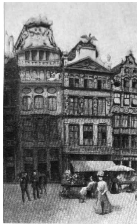
Брюссель. — Уголок Большой площади.

Нарушить же нейтралитет Бельгии вынудили Германию важные военные соображения: только против границ Бельгии на территории Франции не было сплошной цепи укреплений, ибо на прочем пространстве с Германией ее граница была унизана крепостями, представлявшими одну грозную цепь, со своим особым гарнизоном тысяч в 300. Кроме того, эта укрепленная линия была продолжена и на юг с заворотом внутрь страны, гарантируя такую же защиту со стороны швейцарской и даже итальянской границ. Но по границе с Бельгией, на прямых и кратчайших путях к Парижу, французы не построили таких же крепостей, ошибочно положившись на нейтралитет Бельгии. Нужно не забывать, что сказал еще Наполеон, что для