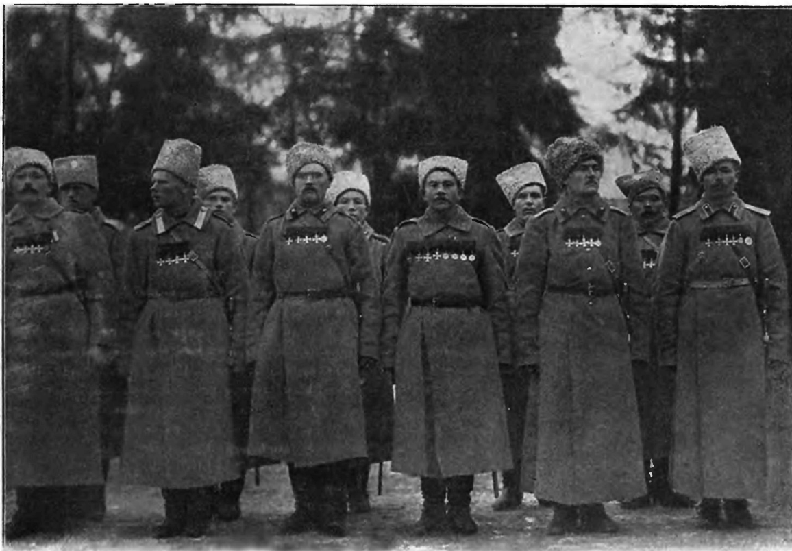
Царская Ставка. Георгіевскій праздникъ въ Высочайшемъ присутствіи. 1915 г. Георгіевскіе кавалеры.

ни были Германія и ея союзники прекрасно оборудованы въ военномъ отношеніи, все таки спорить и бороться со всѣмъ свѣтомъ, со всѣмъ почти міромъ, при нежеланіи этого міра подчиниться нѣмецкой гегемоніи, невозможно. И, несомнѣнно, приказъ по русской арміи на Новый годъ, какъ указующій на твердую волю продолжать борьбу, повергнуть тевтоновъ и ихъ союзниковъ въ глубокое раздумье.