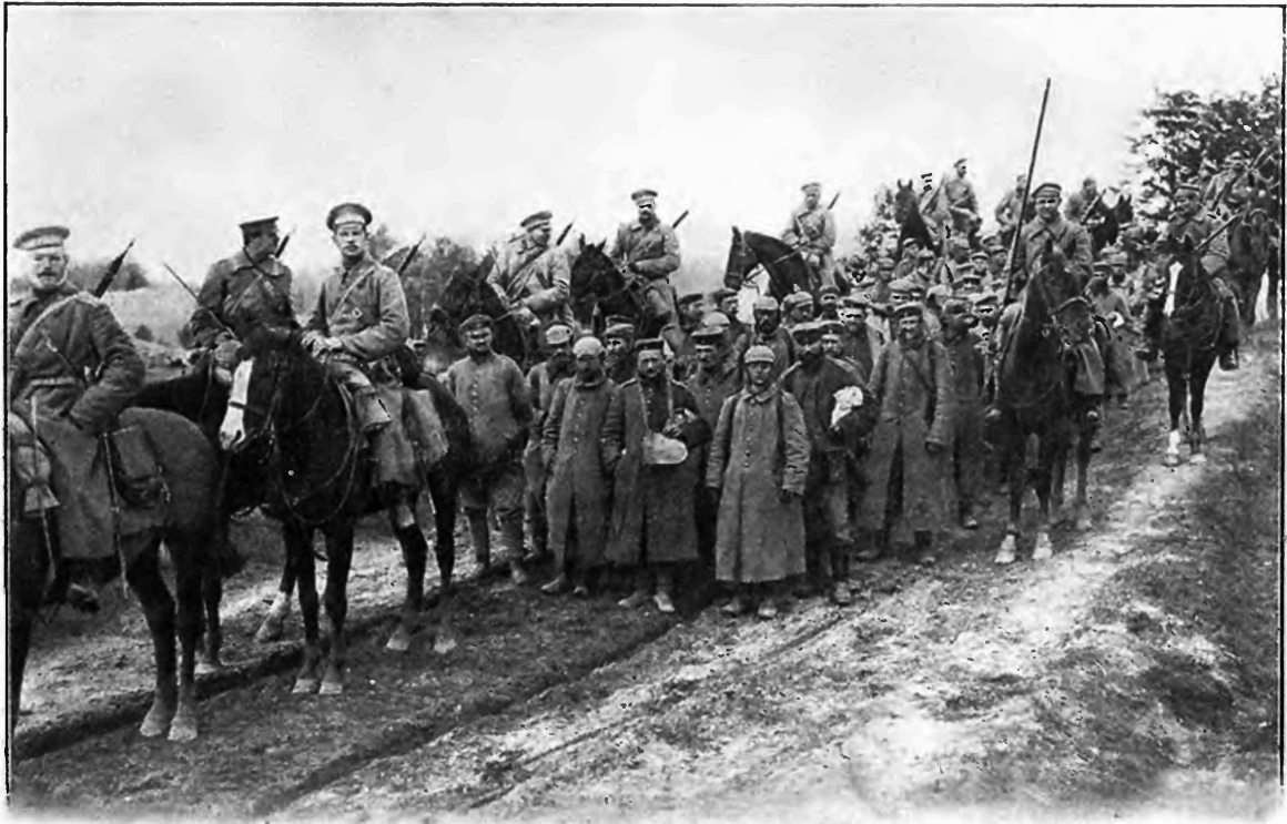
Пѣхоты, взятыя у оз. Свентенъ. 1915 г.

которая проходила передъ Царскими глазами, каждый открывался увѣренностью, что наши войска сумѣютъ постоять за родину. Передъ отбитіемъ съ фронта Государь Императоръ посѣтилъ раненныхъ въ первомъ Георгіевскомъ подвижномъ лазаретѣ.