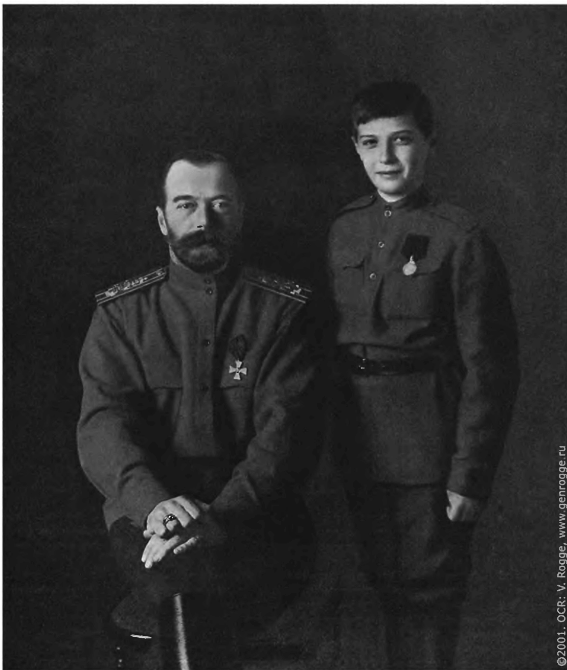
Его Императорское Величество Государь Императоръ Николай Александровичъ и Его Императорское Высочество Наслѣдникъ Цесаревичъ Алексѣй Николаевичъ. Царская Ставка. 1915 г.