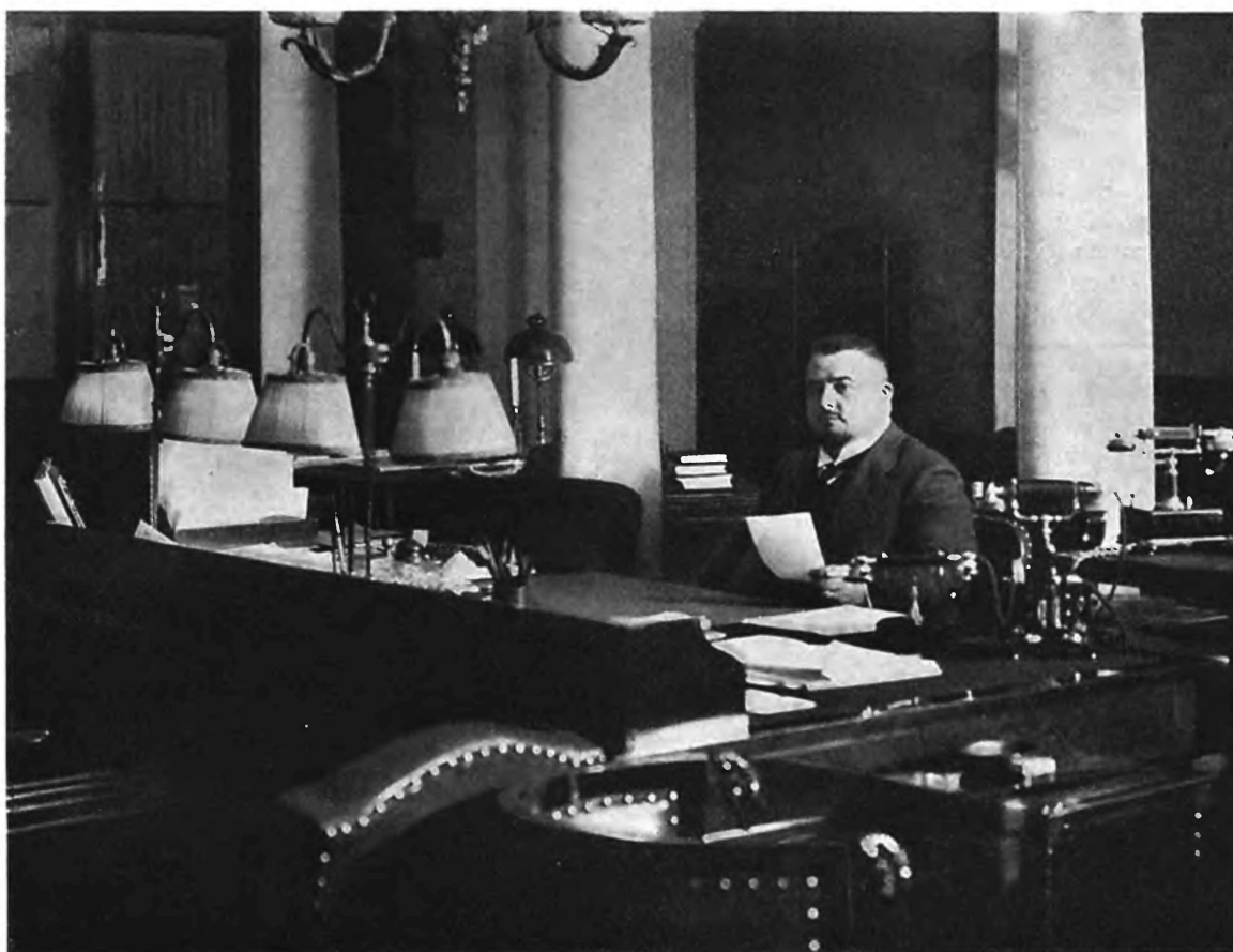
Министръ внутреннихъ дѣлъ, камергеръ Двора Его Величества Алексѣй Николаевичъ Хвостовъ въ своемъ рабочемъ кабинетѣ.

(Фот. собств. корреспондента «Лѣтописи» П. Оцула).