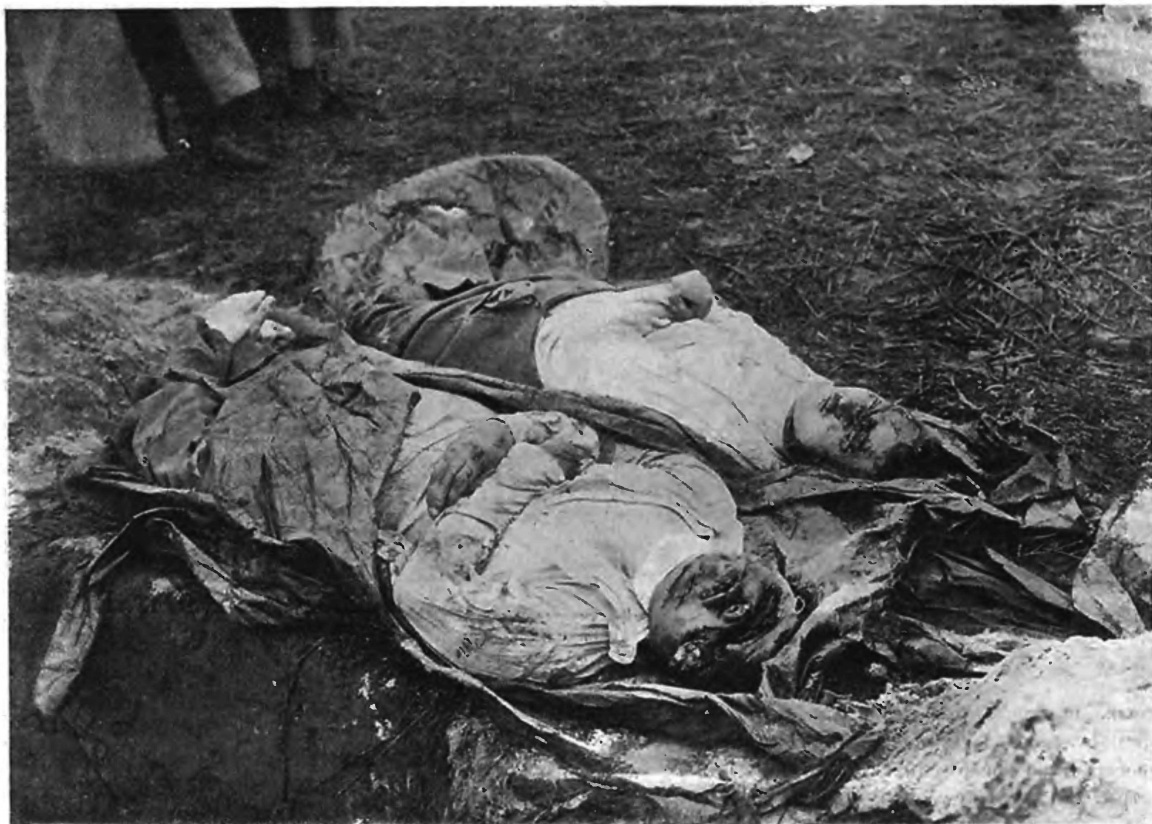
Германскіе летчики, разбившіеся вмѣстѣ съ аэропланомъ, подбитымъ 12-го іюля 1915 г. у п. Щеналково, Ломжинской губ.