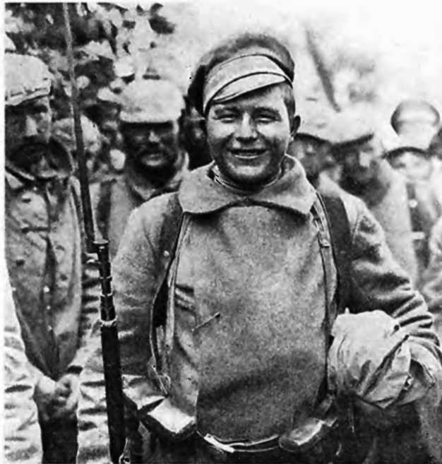
«Нѣмецъ привелъ».

вълѣбляющая и восхитительная, и на этотъ разъ вывела русскія знамена изъ всѣхъ хитрыхъ ловушекъ врага и изъ всѣхъ затрудненій, созданныхъ необычнымъ масштабомъ настоящей войны, масштабомъ, который едва ли могли предвидѣть самыя дальновидныя и самыя осторожныя умы. Кто очень удачно сказалъ, что среди всѣхъ неожиданностей, рожденныхъ мировымъ пожаромъ, едва ли не самая крупнѣйшая это—превзошедшая ожиданія сила германцевъ на морѣ и мощь и доблесть англичанъ на сушѣ. Дѣйствительно, кто бы могъ два—три года тому назадъ убѣжденно утверждать, что