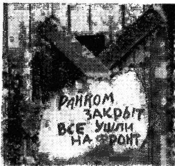
Дверь райкома РКСМ. 1919 г.