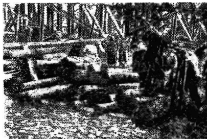
Комсомольский субботник в г. Брянске. 1927 г.

«В 1927 году по улицам Ростова-на-Дону прошла первая колонна из 30 тракторов. Ее вели девушки-комсомолки, воспитанницы детских домов. Огромные толпы приветствовали трактористок, забрасывали их цветами. Колонна уходила на Северный Кавказ — поднимать колхозную целину».