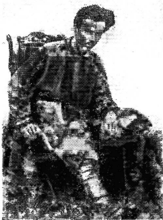
Н. Островский. 1924 г.

Нашими руками пишется сегодня наша глава в великой Книге революции.