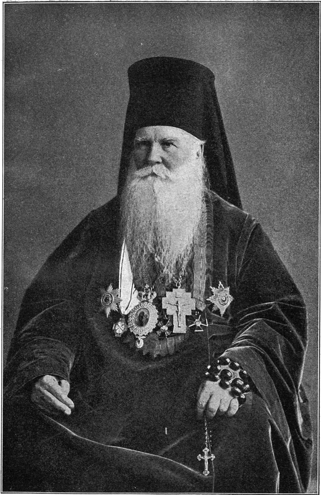
Аѳанасій, архіеп. Донской.