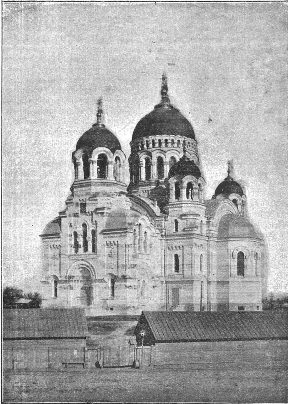
Вознесенскій кафедральный соборъ въ Новочеркасскѣ (недавно отстроенный).

щенъ на Донъ, 12 ноября того же года по болѣзни уволенъ на покой. Скончался 16 апрѣля 1896 г. Изданы были въ свое время его гродненскія поученія въ 4-хъ вып. (2-й выпускъ «Голосъ пастыря по 11, 12, 14).—Нынѣ святительствуетъ на Дону преосвященный 9) Аванасій (Василій Мих. Пархомовичъ); оцъ сынъ священника полтавской епархіи, родился въ 1827 г., по окончаніи въ 1853 г. кiev-