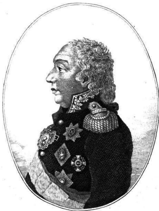
Князь Михаилъ Илларионовичъ ГОЛЕНИЩЕВЪ - КУТУЗОВЪ СМОЛЕНСКІЙ.