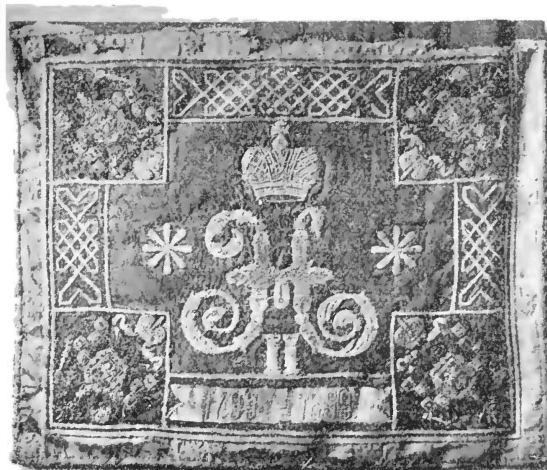
Полотнище полкового Штандарта, пожалованнаго въ день столѣтняго юбилея 11 января 1899 года.