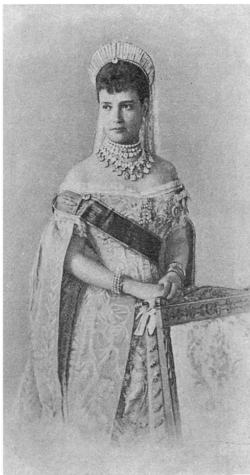
ЕЯ ИМПЕРАТОРСКОЕ ВЕЛИЧЕСТВО ГОСУДАРЫНЯ ИМПЕРАТРИЦА МАРІЯ ФЕОДОРОВНА.