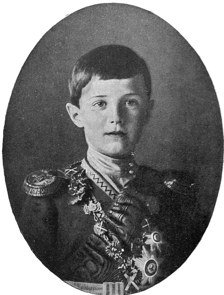
ЕГО ИМПЕРАТОРСКОЕ ВЫСОЧЕСТВО НАСЛѢДНИКЪ ЦЕСАРЕВИЧЪ и ВЕЛИКІЙ КНЯЗЬ АЛЕКСѢЙ НИКОЛАЕВИЧЪ.