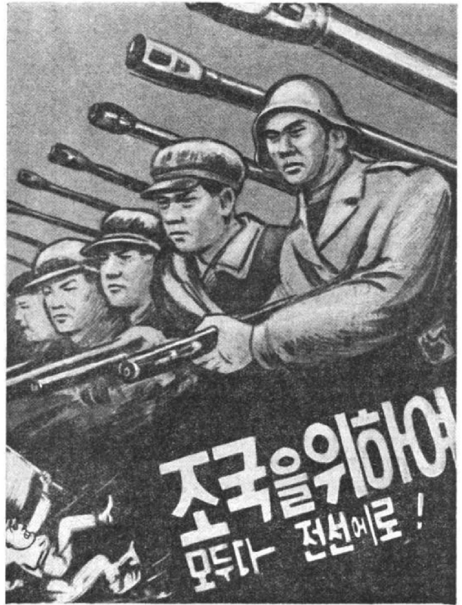
Плакат, опубликованный в пхеньянской газете «Минджю чосон»: «Все на фронт. — за родину!»