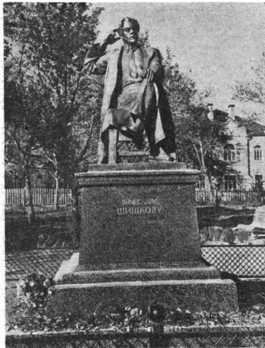
Памятник писателю В. Я. Шишкову, установленный на его родине, в городе Бежецке, Калининской области.

С. МОРОЗОВ, специальный корреспондент «Огонька»