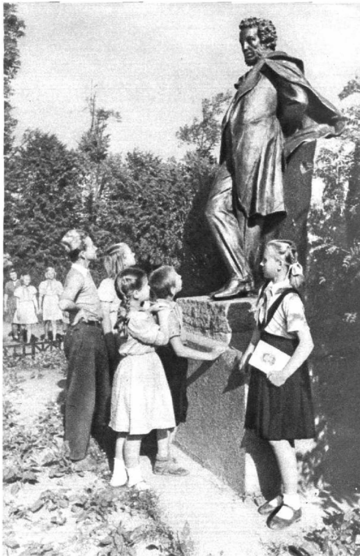
...Прямо против ворот стоит памятник А. С. Пушкину. Великий поэт встречает, так сказать, всех нас, входящих в город, несущих его имя

...Вечером, когда над городом Пушкином уже стояли густые синие сумерки, я снова проходила мимо детского дома. Белые ночи уже закончились, но вечер все же наступал не сразу, и долго плыл, не тая и не уходя, светлый, мягкий полумрак. Деревья в этом сумраке казались еще темнее, а дома — еще светлей. И всюду на улицах города, некогда больно