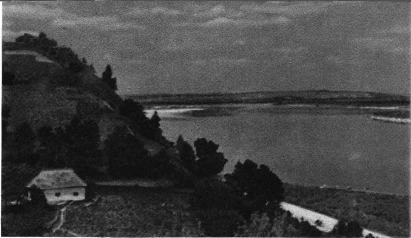
На многие десятки километров видны отсюда Днепр и широкие украинские степи. Здание музея. Здесь экскурсанты знакомятся с жизнью и деятельностью Тараса Шевченко.