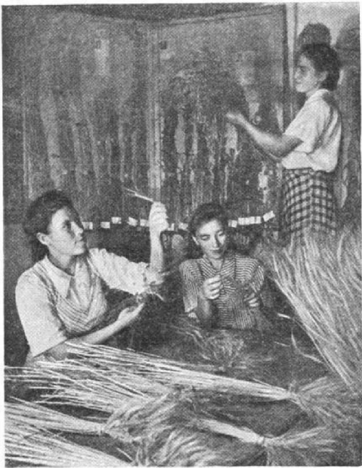
Колхозная лаборатория артели имени Ленина Ессентукского района, Ставропольского края. Здесь готовят экспонаты для районной сельскохозяйственной выставки.