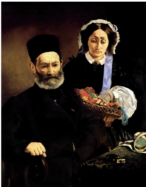
«Портрет г-на и г-жи Мане», 1860, холст, масло. Музей д'Орсэ, Париж

«Надо быть современником и писать то, что видишь» — от этих сказанных в юности слов Мане не отступал никогда. Он создавал свои образы, вдохновляясь мотивами, почерпнутыми у именитых мастеров прошлого, — именно так он старался определить место современного человека в искусстве.