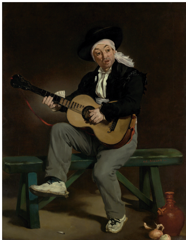
«Испанский гитарист», 1860, холст, масло. Метрополитен-музей, Нью-Йорк

мым предоставив возможность своим выдающимся современникам, таким как, например, Клод Моне, совершать свои собственные открытия.