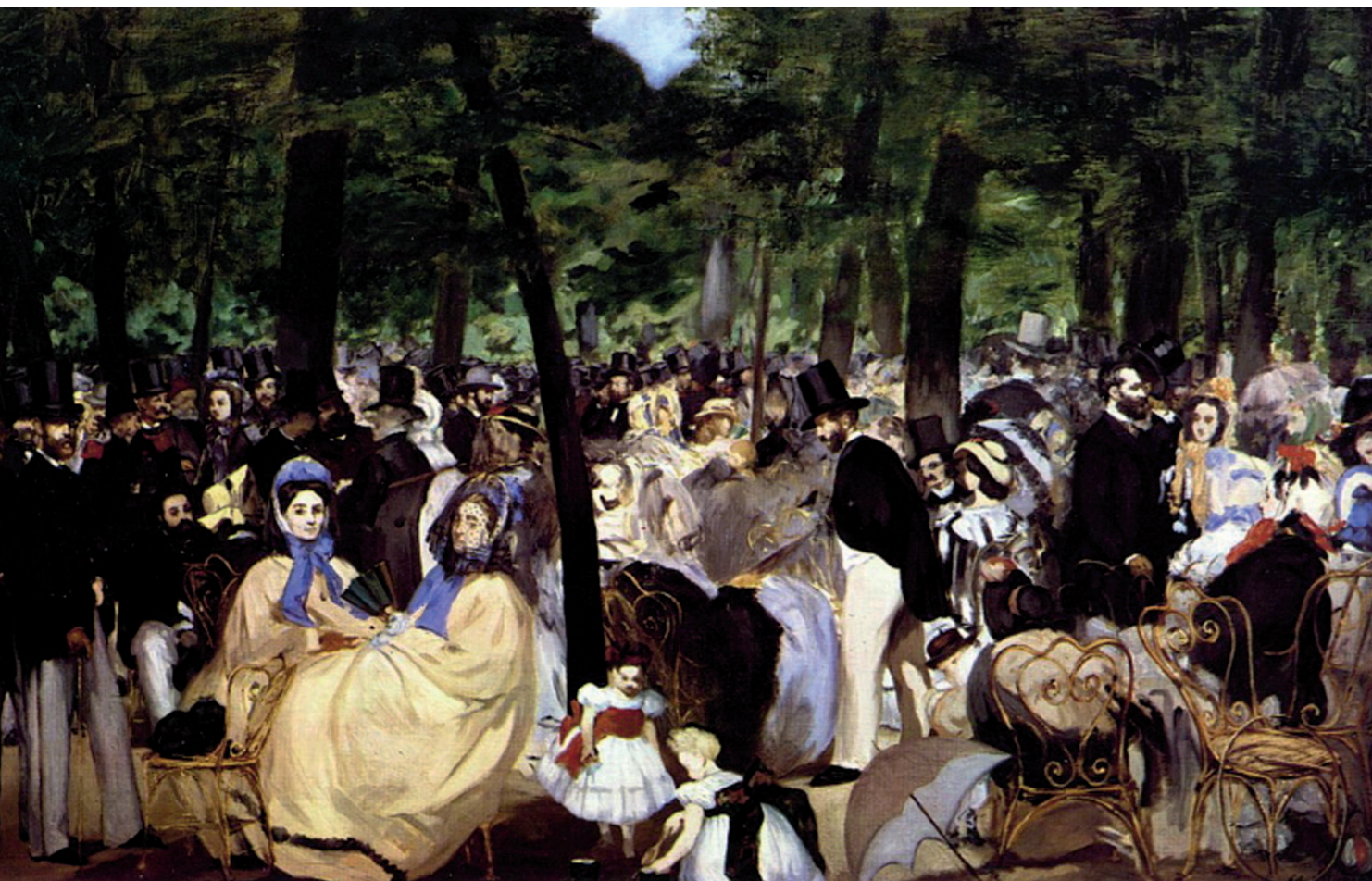
«Музыка в Тюильри», 1862, холст, масло. Лондонская Национальная галерея, Лондон

Путешествие через Атлантику и пребывание в Рио-де-Жанейро оставили глубокий след в сознании Мане. Перед ним, родившимся под серым небом Парижа и воспитывавшимся в благонаправной и скучной среде столичных буржуа, впервые предстали красоты солнечных южных просторов с их яркими красками и фантастическими пейзажами. Безусловно, то удивительное ощущение моря, которое впоследствии отличало Мане-мариниста, родилось в его душе именно в то время.