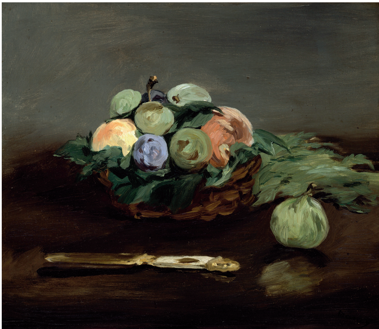
«Корзина фруктов», 1864, холст, масло. Частная коллекция

Мане стал лауреатом Салона, и восторгу молодого художника не было предела. Однако впервые посетить Испанию Мане удалось лишь в 1865 году, но и до этого года, равно как и после, испанская живописная традиция во многом влияла на работу художника. Впрочем, Мане вообще восхищался Испанией как таковой. Предположительно, «Испанский гитарист» был написан под впечат-