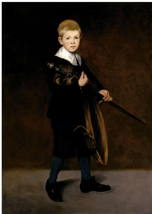
«Мальчик со шлягой», 1861, холст, масло. Метрополитен-музей, Нью-Йорк

Родители прочили Эдуарду юридическую карьеру. Однако юноша решительно заявил отцу, что не чувствует ни малейшей склонно-