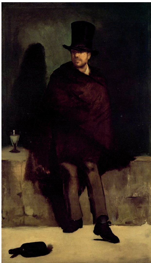
«Любитель абсента», 1858–1859, холст, масло. Новая галерея Карлсберга, Копенгаген

Эдуард Мане — французский живописец и график, один из ярчайших художников, положивших начало импрессионизму. Наряду с работами Эдгара Дега и Огюста Ренуара творчество Мане стало своеобразной переходной ступенью от культуры Высокого Возрождения к культуре новейшего времени. Именно Эдуард Мане первым начал экспериментировать с композицией и светом, тем са-