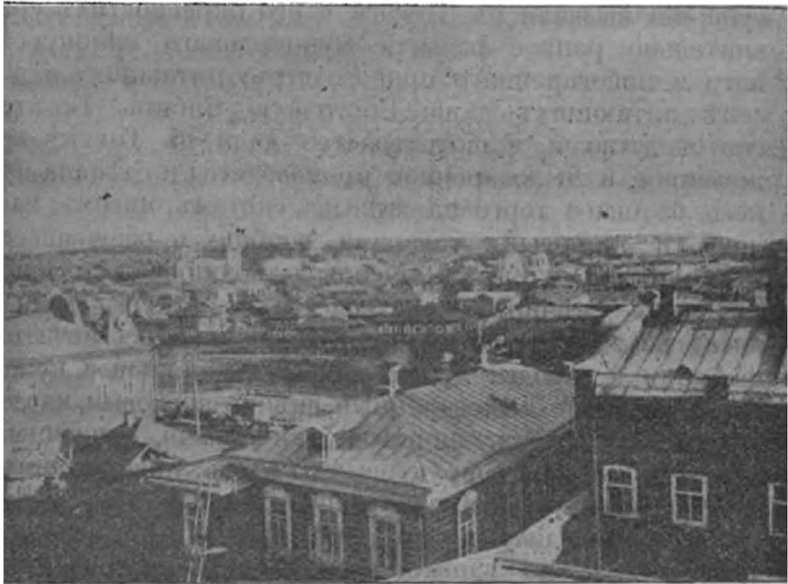
Современный Томскъ. (Видъ съ Воскресенской горы).

губернскимъ прокуроромъ—Духъ. О первыхъ жителяхъ города Томска, по сохранившимся записямъ можно составить себѣ приблизительную и не симпатичную картину. Здѣсь царило пьянство и развратъ во всѣхъ слояхъ общества. Да и нѣтъ въ этомъ ничего удивительнаго. Колонизація Сибири началась по почину нашего правельтельства, рѣшившаго основать въ этой отдаленной странѣ