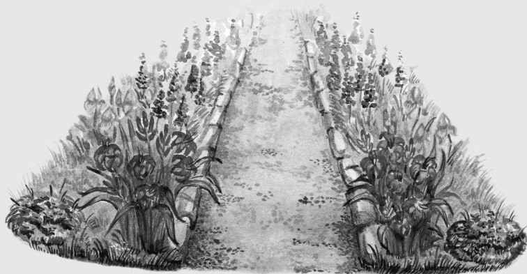
Композиция в воздушной перспективе

С помощью линейной перспективы визуально изменяют формы и положение в пространстве различных объектов композиции, например, уменьшают или увеличивают расстояние между элементами (посадками, отдельно стоящими деревьями; оптически уменьшают ширину дорожки и т. п.).