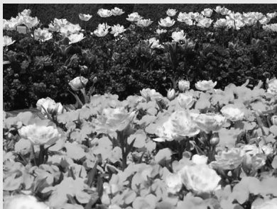
Цвет является одной из главных составляющих любой композиции

Теплые цвета при дневном освещении оптически создают впечатление близко расположенных. Поэ-