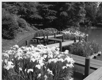
Композиция, построенная по соотношению конфигураций. В данном случае округлая береговая линия водоема контрастирует с ровными прямыми углами мостика

● передний план. Оформляют одиночными деревьями, групповыми посадками, аллеями, террасой, беседкой;