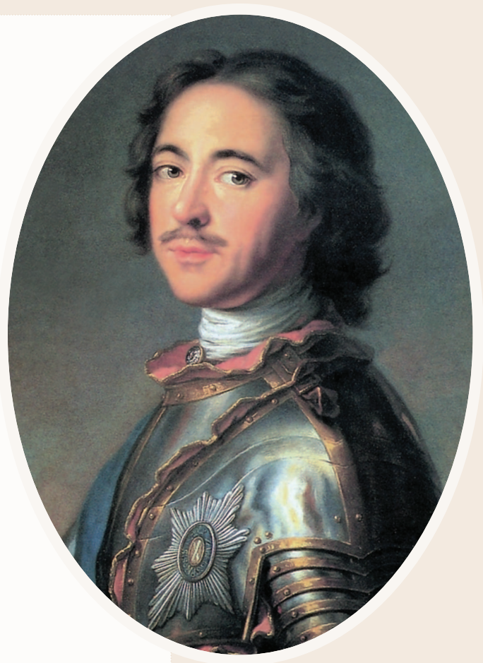
Ж. М. Натъе. Пётр I

В 1682 году, в десятилетнем возрасте, его дедушка Пётр I пережил страшное. Разъярённая толпа