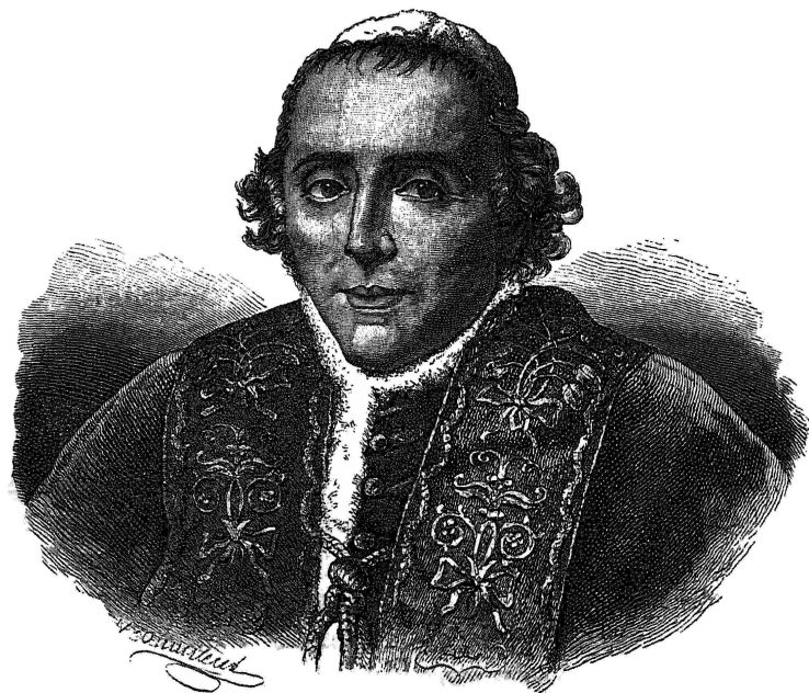
Пій VII (изъ 5-го выпуска).

съ его движущей силой—сомнѣнiемъ, приобрѣлъ массу познанiй, которыя оказываются несогласными съ какимъ нибудь церковнымъ преданiемъ, миллионы людей, слишкомъ слабыхъ для того, чтобы самимъ составить себѣ ясныя убѣжденiя въ руководство для своей нравственной жизни, удаляются отъ этой путаницы отовсюду проникающихъ въ жизнь идей въ безопасную гавань историческихъ преданiй, которыя разрѣшаютъ неразрѣшенные вопросы съ помощью успокоивающей вѣры. Съ другой стороны, самыя вѣроисповѣданiя,