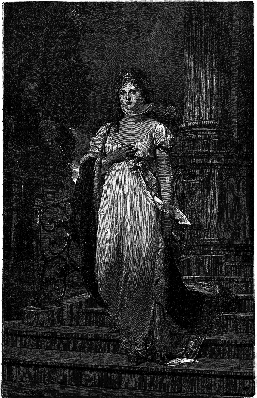
Луиза; королева прусская (изъ 3-го выпуска).