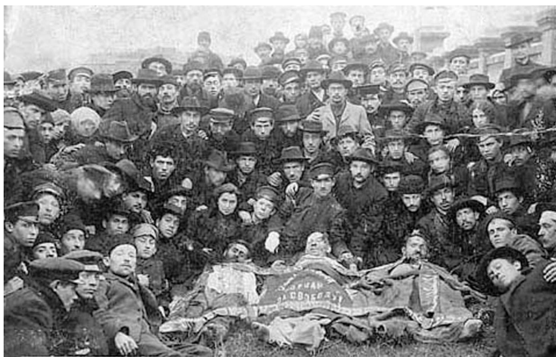
Члены Бунда с телами товарищей, убитых в Одессе во время революции 1905 г.

России. При этом особая стойкость требовалась от окраинных социал-демократов, непосредственно сталкивающихся с националистическим движением.