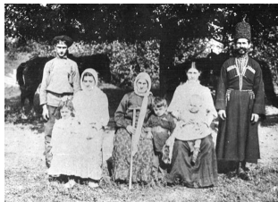
Грузинская семья в начале XX в.

Взять хотя бы грузин. Грузины дореформенных времен жили на общей территории и говорили на одном языке, тем не менее они не составляли, строго говоря, одной нации, ибо они, разбитые на целый ряд оторванных друг от друга княжеств, не могли жить общей экономической жизнью, веками вели между собой войны и разоряли друг друга, направляя друг на друга персов и турок. Эфемерное и случайное объединение княжеств, которое иногда удавалось провести какому-нибудь удачнику-царю, в лучшем случае захватывало лишь поверхностно-административную сферу, быстро разбиваясь о капризы князей и рав-