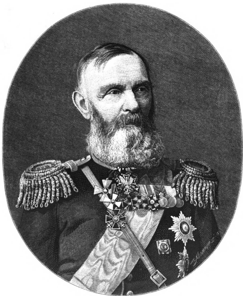
ГЕНЕРАЛЪ-ОТЪ-ИНФАНТЕРИИ ВАЛЕРІАНЪ АЛЕКСАНДРОВИЧЪ БЕЛЪГАРДЪ.