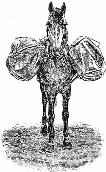
Лодка на вьюкѣ.