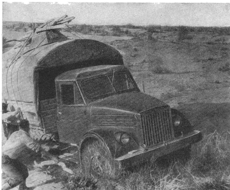
Рис. 4. Переход через пески пустыни Кызыл-Кум.