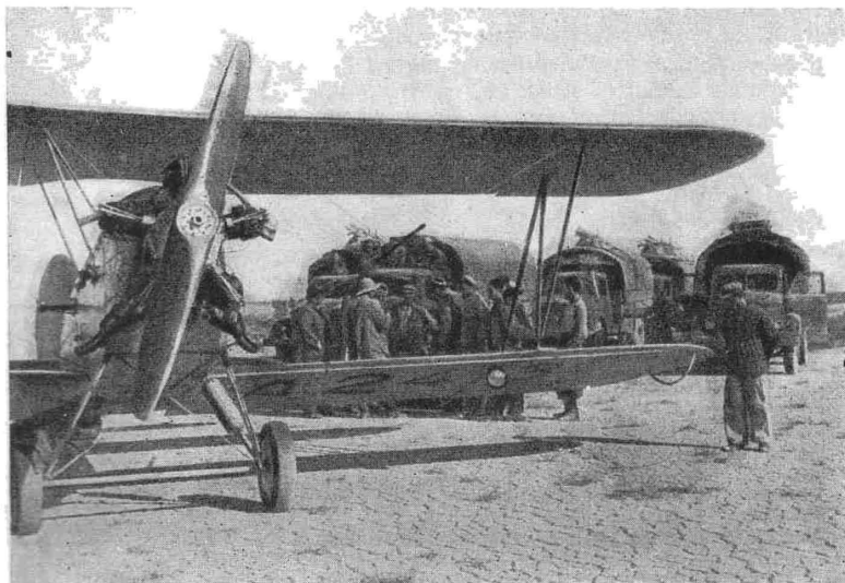
Рис. 3. В пустыне Кызыл-Кум встретились участники наземного и авиаразведочного маршрутов экспедиции.