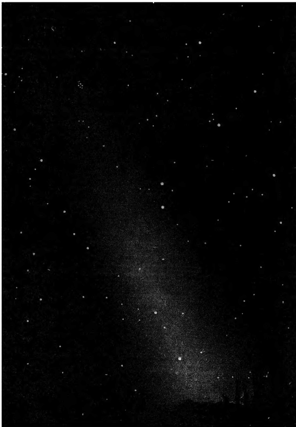
Рис. 1. Вечные свидетели земных дел. Небесные светила и зодиакальный свет.