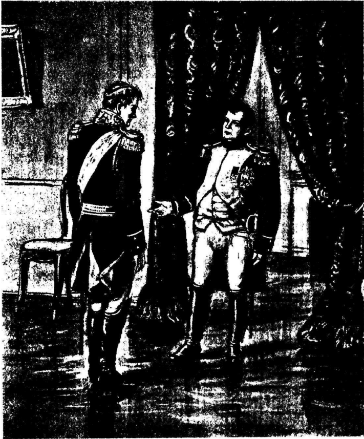
Рис. 2. Балашевъ передъ Наполеономъ.

Онъ вышелъ быстро, подрагивая на каждомъ шагу и откинувъ нѣсколько назадъ голову. Вся его потолстѣвшая, короткая фигура, съ широкими, толстыми плечами и невольно выставленнымъ впередъ животомъ и грудью, имѣла тотъ представительный, осанистый видъ, который имѣютъ въ холѣ живущіе