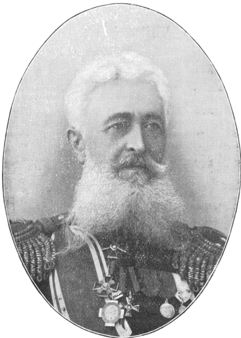
Военный Губернаторъ Амурск. обл К. Н. ГРИВСКІЙ.