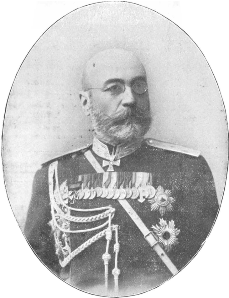
Пріамурскій Ген.-Губернаторъ, генер.-отъ-инфантеріи Н. И. ГРОДЕКОВЪ.