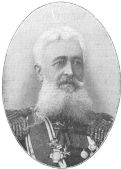
Военный Губернаторъ Амурск. обл. К. Н. ГРИВСКІЙ.