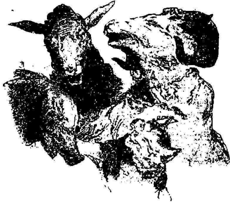
Рис. 6. Иллюстрація къ сказкѣ П. Рычоловскаго „Козель-Мелека, приключеніе козла Мелеки и его друзей“. 1870 г. Литографирована у А. А. Пльша.

Исполнилъ иллюстраціи къ «солдатской» и «народной» азбукамъ г. Столпянскаго. Въ первой изъ этихъ азбукъ было