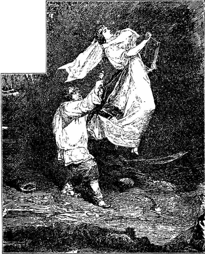
Рис. 5. Царь-дѣвица, улетающая отъ Ивана-дурачка. Иллюстрація къ сказкѣ Ершова: „Конекъ-Горбунокъ“. 1870 года. Литографирована у А. А. Ильина.

Для Ильина Васнецовъ изготавидь иллюстраціи къ сказкѣ Ершова «Конекъ - Горбунокъ» — на одномъ большомъ листѣ (См. рис. 4 и 5).