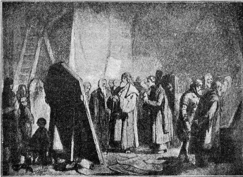
Рис. 3. Князеская иконописная мастерская . 1870 года. Рисунокъ карандашомъ.

Въ 1870 году Викторъ Михайловичъ нарисовалъ: «Купца», «Дьячка» и «Крестьяна за столомъ» (первый рисованъ карандашомъ, остальные перомъ. Находятся въ Третьяковской галереѣ).