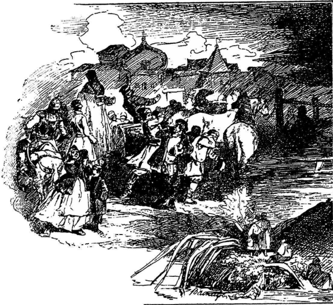
Рис. 4. Иллюстрація къ сказкѣ Ершова: „Колѣксъ-Горбунокъ“. 1870 г. Литографирована у А. А. Ильина.

Нарисоваль на заданную Императорской Академіей Художествъ тему эскизъ: «Кляжеская иконописная мастерская». (См. рис. 3). «И князь съ благодушнымъ лицомъ и осанистой фигурой, стоящій опершись на палку, въ широкой шубѣ, съ тяжелымъ крестомъ на груди и съ изящной шапочкой на головѣ; и два боярина по сторонамъ, одинъ изъ нихъ важный и величавый, другой—тонкій-хитрякъ и лисица,—всѣ трое стоятъ предъ громадною иконою, болѣе чѣмъ въ ростъ человѣческой, написанною на доскѣ, ладони въ двѣ толщины, и другіе бояре, разсматривающіе другія иконы въ углу; и мальчишка учени-