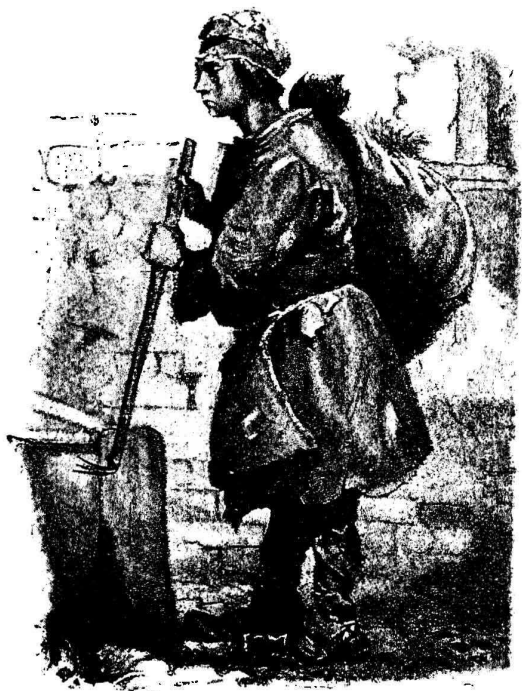
Рис. 2. Тряпичникъ . 1869 г. По литографіи А. А. Ильина.

ніе», а также рисунки его съ другихъ художниковъ: «Рыбачья хижина на берегу Азовскаго моря», «Буря на Черномъ морѣ», «Видъ Исаакіевскаго собора при лунѣ» и «Окрестности Петербурга зимою»,—первые три съ Куинджи, послѣдній—съ Топорова.