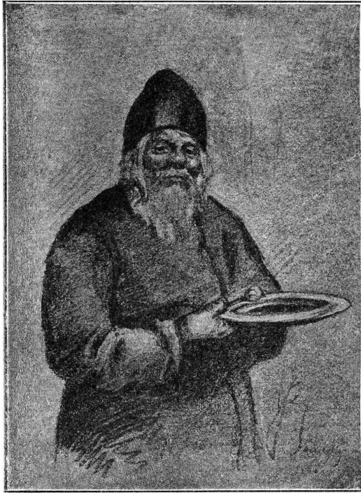
Рис. 1. Сборщикъ-монахъ . 1868 года. Рисункъ карандашомъ. Изъ собранія И. Е. Цвѣткова, въ Москвѣ.

Такъ, въ литографіи Ильина уцѣлѣлъ до настоящаго времени одинъ лишь экземпляръ очень хорошей Васнецовской литографіи «Тряпичникъ» (См. рис. 2), изготовленной въ 1869 году.