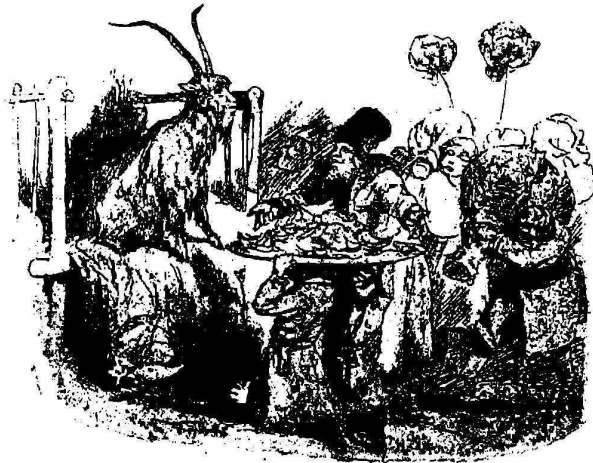
Рис. 7. Козель-Мелека. 1870 года. Хромолитографія изъ собранія Е. М. Бѣвъ.

30 картинокъ, во второй 45,—всѣ онѣ очень небольшія. Очень интересны въ «солдатской азбукъ» слѣдующіе рисунки: