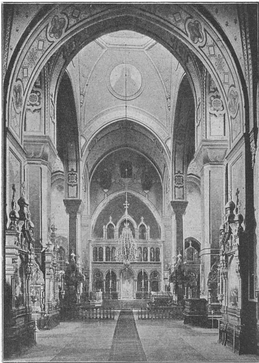
Внутренній видъ церкви св. муч. Мирона.