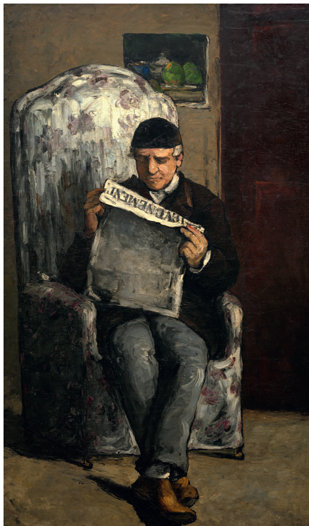
«Отец художника, читающий газету “L'Evenement”», 1866, холст, масло. Национальная галерея искусств, Вашингтон

Сезанн глубоко переживал отъезд Золя, чувствуя себя невероятно одиноким. Он писал дру-