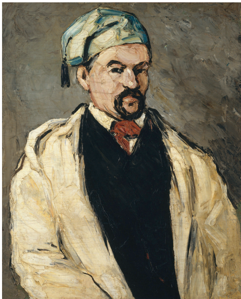
«Портрет дяди Доминика», 1866, холст, масло. Метрополитен-музей, Нью-Йорк

В этот же год в коллеж поступает еще один мальчик, Эмиль Золя, который сразу же становится изгоем. Одноклассники не любят его