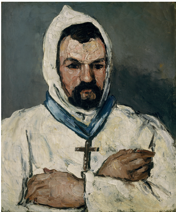
«Дядюшка Доминик в облачении монаха», 1866, холст, масло. Метрополитен-музей, Нью-Йорк

и изводят нападками. Эмиль для учащихся — чужак, парижанин. Он говорит со смешным акцентом, да к тому же еще неуклюж, стеснителен и близорук. И хуже всего — он беден. Только Поль Сезанн не участвует в травле, он считает Эмиля славным малым и не прочь с ним подружиться.