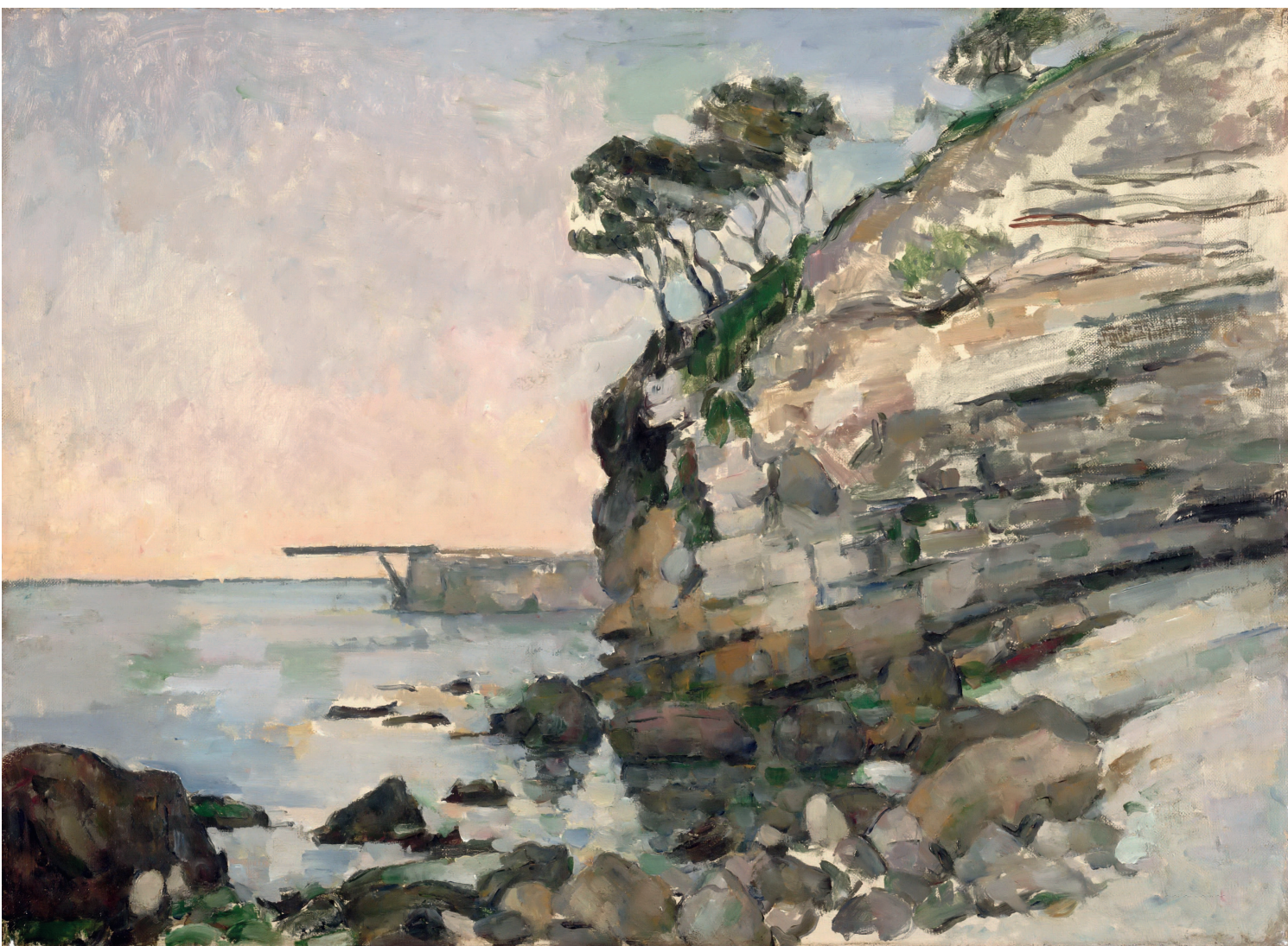
«Эстак, утро», 1870, холст, масло. Лувр, Париж

Скопив неплохой капитал, Луи-Огюст купил загородный дом Жа де Буффан (Жилище ветров). Это было старинное здание XVIII века, окруженное парком, к которому вела ве-