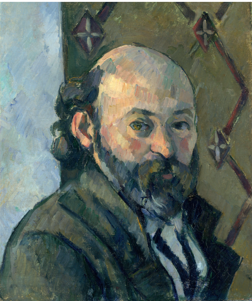
«Автопортрет», 1880–1881, холст, масло. Лондонская Национальная галерея, Лондон

Поль Сезанн — выдающийся французский художник, всемирно признанный мастер постимпрессионизма. Его работы оказали огромное влияние на становление авангардистских течений в искусстве XX века, таких как фовизм и кубизм. За всю жизнь им было написано более чем восемьсот полотен.