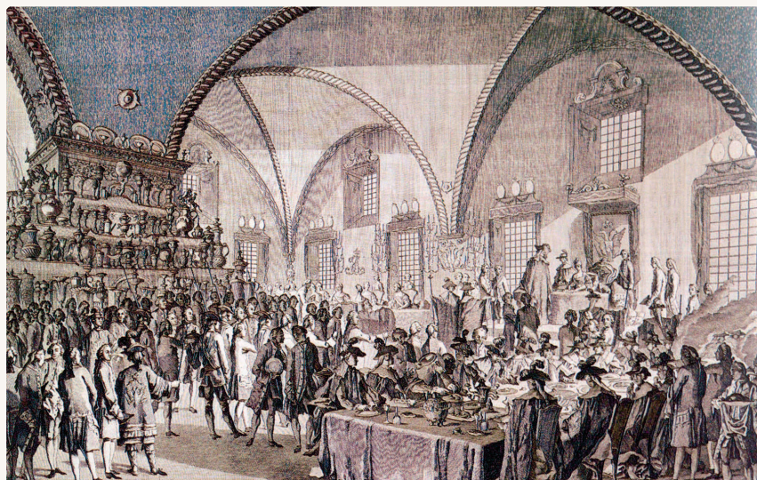
Красное крыльцо и Грановитая палата в день коронации Екатерины