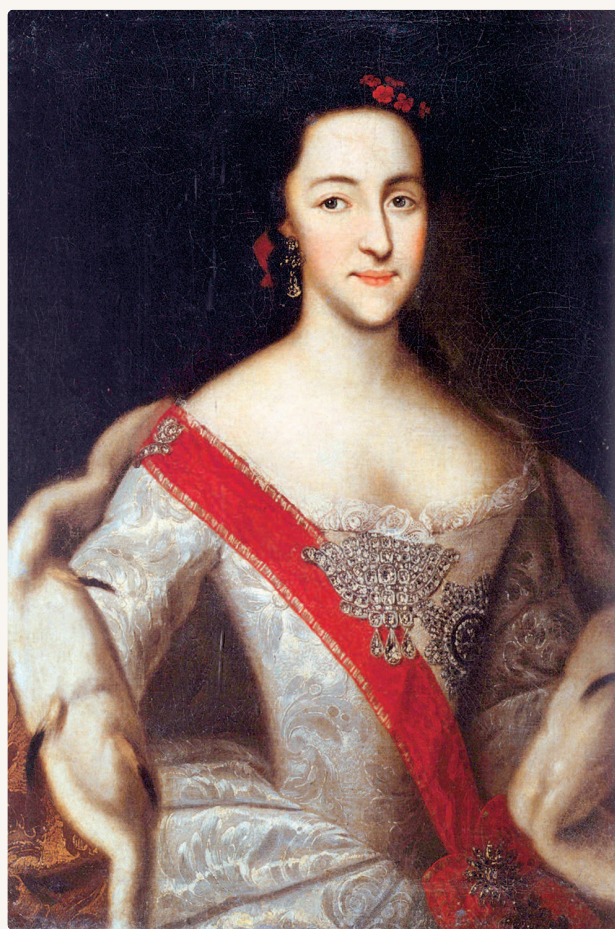
Портрет юной Екатерины

Супружеская жизнь молодых людей оказалась неполноценной. Петр не скрывал, что не любил свою жену, хотя и был к ней привязан. А Екатерина довольно быстро нашла утешение в любовных связях с другими мужчинами.