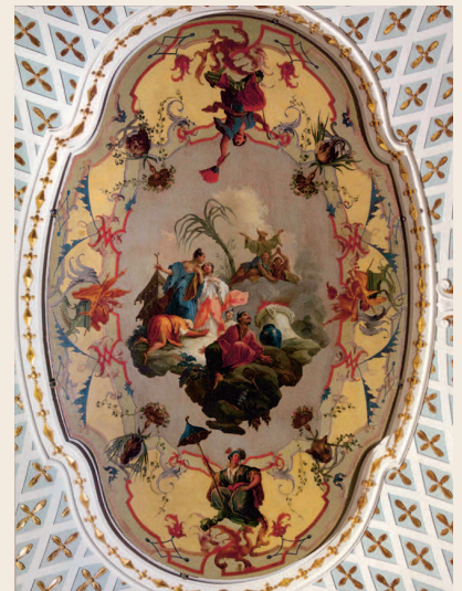
Ораниенбаум. Китайский дворец. Плафон спальни Екатерины II

В 1762 г., после смерти императрицы Елизаветы Петровны, на русский трон вступил муж Екатерины — Петр III. Правление его не продлилось и года. В том