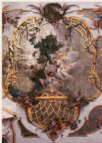
Ораниенбаум. Декор одного из дворцовых залов.

же 1762 г. Екатерина Алексеевна вместе со своими сподвижниками совершила переворот и сама заняла престол. Вскоре после этого ее несчастный муж умер, вероятнее всего, насильственной смертью.