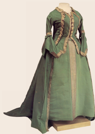
Форменное платье Екатерины, шефствовавшей над Преображенским полком