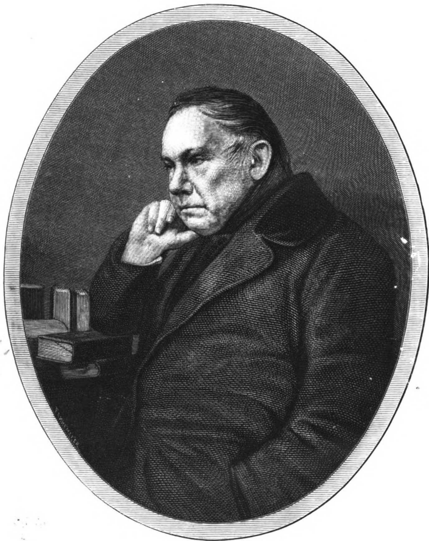
ВАСИЛІЙ АНДРЕЕВИЧЪ ЖУКОВСКІЙ.