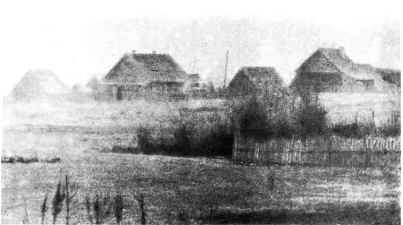
Святое, теперь Партизанское, тоже было сожжено.

нет. По лесам, по топам, по открытым лугам пробирались три дня, бережно прижимая к телу не мины даже — простые артиллерийские снаряды. Наконец мост... Как томительно ожидание! С рассветом фашисты оставляли на мосту одного часового, остальные уходили отсыпаться, чтобы ночью быть начеку. Не дождались они следующей ночи! Часового партизаны сняли из «бесшумки», а фа-