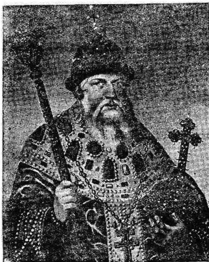
Великій Государь, Царь Алексѣй Михайлович.

Большая и чрезвычайно интересная архивная работа по изу-