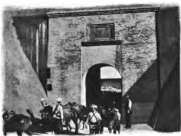
Наши казаки у Великой Китайской стѣны.