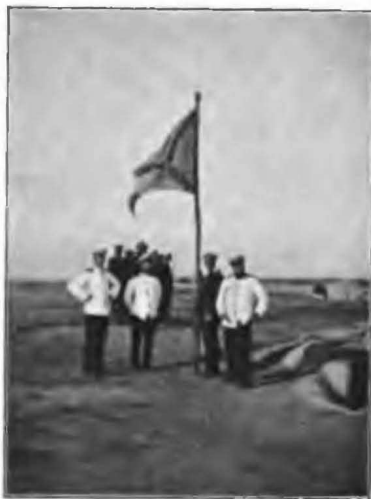
Подъемъ Русскаго Андреевскаго флага въ Шанхайгуанъ въ 1900 г.

Иль Русскій отъ побѣдъ отвыкъ? Иль мало насъ? Или отъ Перми до Тавриды, Отъ Финскихъ хладныхъ саялъ до пламенной Колхиды, Отъ потрясеннаго Кремля До стѣнъ недвижнаго Китая, Стальной щетиною сверкая, Не встанетъ Русская земля?