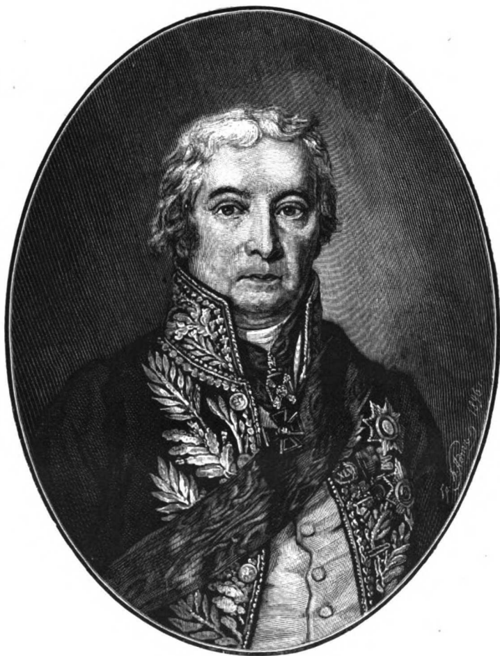
ПАВЕЛЪ ГАВРИЛОВИЧЪ ДИВОВЪ.