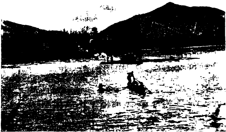
Плотъ на мели. Переправа на берегъ.

наконецъ причалили къ деревнѣ; цѣлая толпа мальчишекъ высыпала на берегъ и помогла намъ добраться со всѣмъ нашимъ багажомъ до земской квартиры, гдѣ мы должны были провести пренеприятную ночь, съѣдаемые мухами и клопами.