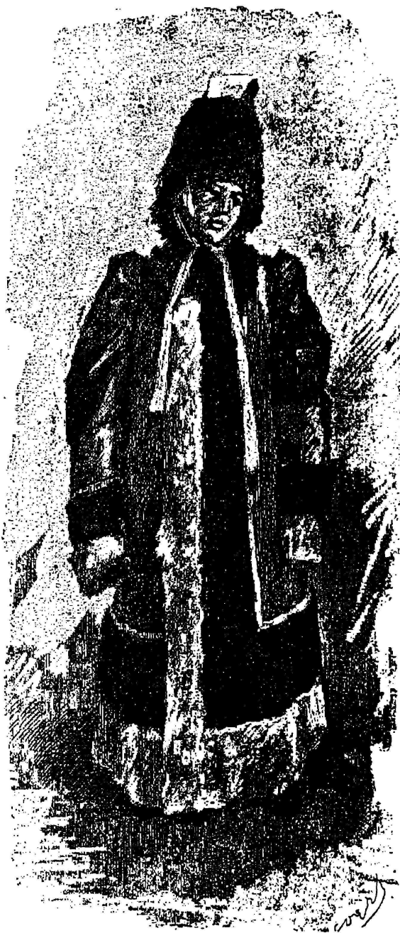
Якутка въ зимней одеждѣ.