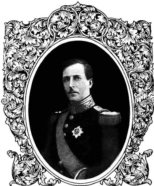
Его Величество Король Бельгіи АЛЬБЕРТЪ

Но вотъ побѣдоносное русское «ура» разнеслось по Балканамъ. Русскіе были у вратъ Царьграда. Настала была часъ славянской свободы.