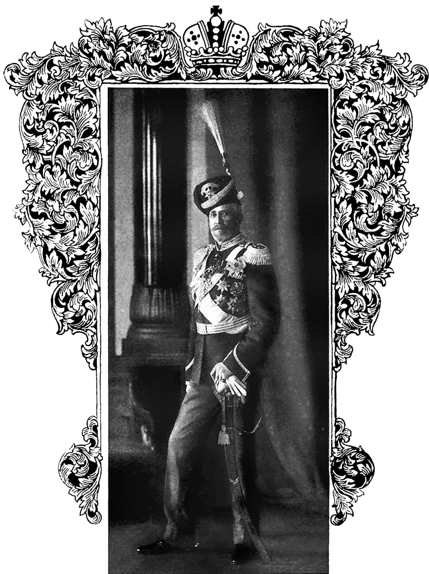
Его Императорское Высочество Верховный Главнокомандующий Беликий Князь НИКОЛАЙ НИКОЛАЕВИЧЪ