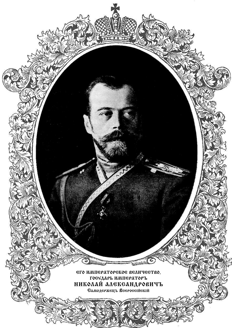
ЕГО ИМПЕРАТОРСКОЕ ВЕЛИЧЕСТВО, ГОСУДАРЬ ИМПЕРАТОРЪ НИКОЛАЙ АЛЕКСАНДРОВИЧЪ САМОДЕРЖЕЦЪ ВСЕРОССИЙСКІЙ