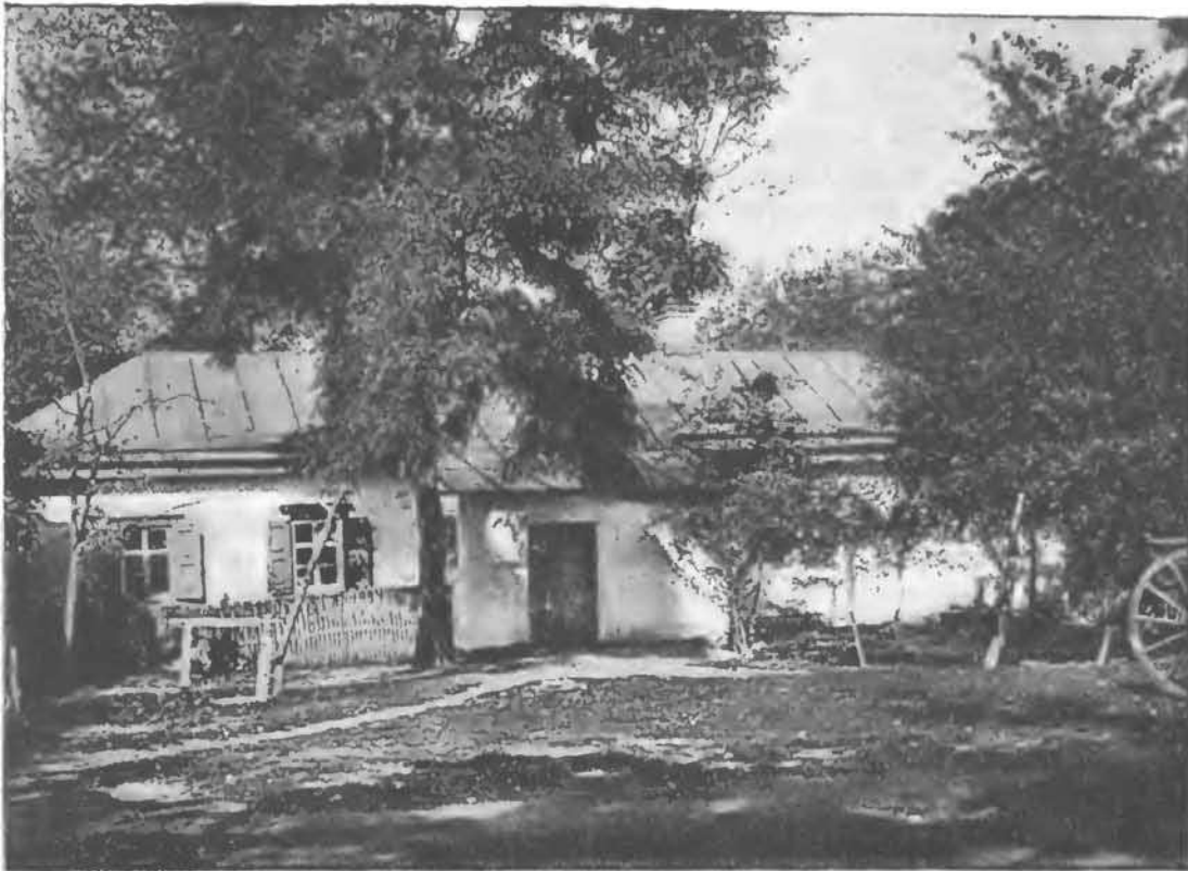
Сорочинцы. Домъ, въ которомъ родился Н. В. Гоголь.

помѣ помещичьемъ домикѣ, владѣтель котораго во всемъ околоткѣ славился, какъ прекрасный разсказчикъ малороссійскихъ анекдотовъ и преданій. Въ то время педалеко отъ Васильевки, въ своемъ имѣнн Кибинцахъ, поселился на покой бывшій министръ, старый вельможа Трощинскій; красивый домъ его, великолѣпно отдѣланный и наполненный всеми предметами искусства и роскоши, скоро сдѣлался сборнымъ мѣстомъ для окрестныхъ помѣщиковъ и заѣзжихъ гостей. Василій Аѳанасьевичъ Гоголь былъ въ родствѣ съ Трощинскимъ и, благодаря своимъ литературнымъ талантамъ, пользовался его особымъ благоволеніемъ. Около этого времени въ малороссійскомъ обществѣ начинается пробуждаться интересъ къ поэзіи на родномъ нарѣчій, въ особенности къ малороссійскимъ шутливымъ пьесамъ съ нѣпьемъ, въ родѣ «Наталки-Полтавки» Котля-