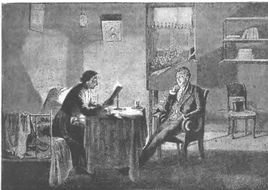
А. С. Пушкинъ у Н. В. Гоголя.

Возьмемъ для примѣра одну изъ этихъ сказокъ: «Ночь передъ Рождествомъ». Въ основу ея Гоголь положилъ малорусскую сказку о веселомъ кузнецѣ Яремкѣ, который всячески унижалъ и позорилъ чорта и за то подвергся отъ него большой опасности, но благополучно освободился отъ нея и наказалъ чорта еще чувствительнѣе. Гоголь воспользовался также и другими народными вѣрваніями (о летаніи вѣдьмъ, о похищеніи ими звѣздъ) и анекдотами (о любов-