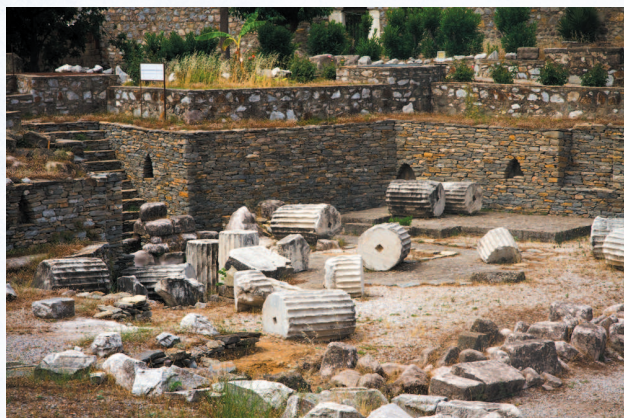
Развалины легендарного мавзолея

Слишком отчаянное стремление к славе могло очень плохо закончиться для ее искателя. Вспомните печальную историю знаменитого скульптора Фидия, автора