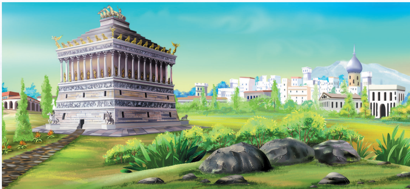
Пятое чудо света — мавзолей в Галикарнасе

На Эгейском побережье современной Турции, аккурат напротив греческого острова Кос, примерно в трехстах километрах к западу от самого популярного турецкого курорта Анталии, находится