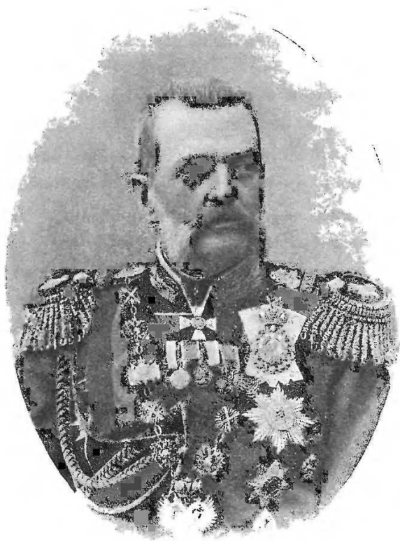
Е. И. В. Великій Нязь Владиміръ Александровичъ. Главнокомандующій войсками Гвардіи и Петербургскаго военного округа съ 1881 по 1905 годъ.

„Разставаясь съ войсками Гвардіи и Петербургскаго военного округа, долгомъ считаю отдать полную справедливость примѣрно усердной и ревностной службѣ Моихъ ближайшихъ сотрудниковъ, неусыпнымъ стараніемъ которыхъ Я постоянно былъ удостоиваемъ Всемилоостивѣйшаго благоволенія въ Божѣ почившаго Государя Императора.