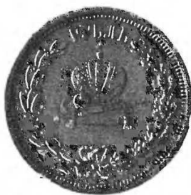
Серебряный рубль въ память Священнаго Коронованія Императора Александра III.

ился на Тверской улицѣ развернутымъ фронтомъ, лѣвымъ флангомъ отъ дома генералъ-губернатора по направленію къ Кремлю. Затѣмъ послѣдовалъ объѣздъ батальона высшими начальствующими лицами коронаціоннаго отряда.