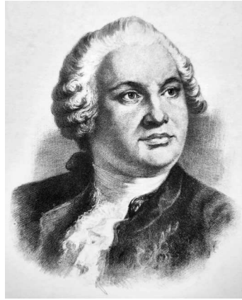
Михаил Васильевич Ломоносов (1711–1765) — философ, русский учёный- естествоиспытатель

Свой вклад в историю изучения познания внесла и Россия. Феномен Михаила Ломоносова (1711–1765), «универсального человека» — энциклопедиста, физика, химика и философа, — положил начало философии как методологического начала, способствующего пониманию сущности вещей или тайны самой материи. Для Ломоносова основой познания был опыт, одновременно являющийся и критерием истинности познанного. Он писал: «Один опыт я ставлю выше, чем