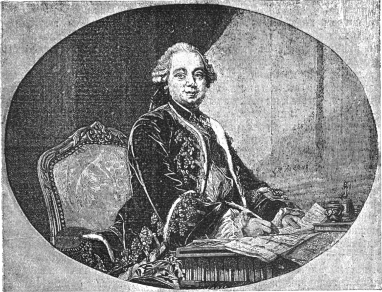
Графъ Этьенъ Франсуа де Шуазель, министр иностранныхъ дѣлъ при Людовикѣ XV. (Съ картины ванъ-Лоо въ Версальскомъ музеѣ).

Наполеонъ Бонапартъ былъ представителемъ переходной эпохи, служившей преддверіемъ въ девятнадцатое столѣтіе. Эпоха эта является самою бурною и все-таки самою плодотворною во всей