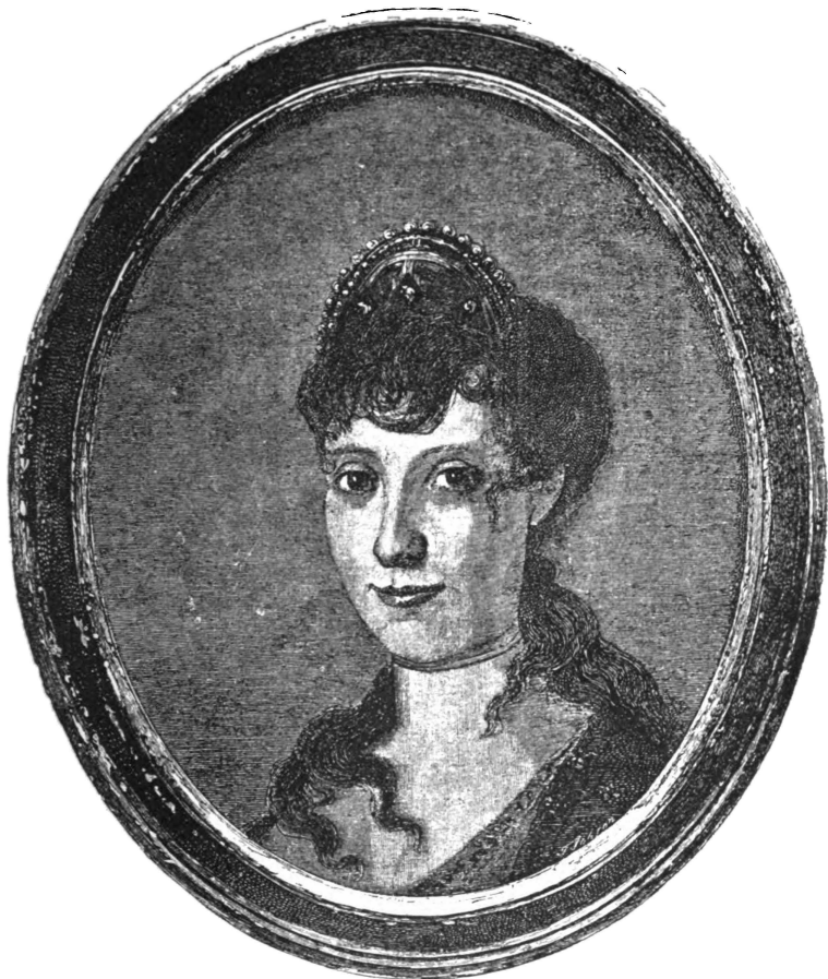
Мать Наполеона, Летиція Буонапарте, рожденная Рамолина. (Съ портрета, находящагося въ комнатѣ, гдѣ родился Наполеонъ).

разрывъ былъ не продолжителенъ, но все-таки онъ далъ Паоли возможность вернуть государству обширныя захваченныя монастырями помѣстья и воспрепятствовалъ католическому духовенству воспользоваться могущественнымъ своимъ вліяніемъ на суевѣрныхъ крестьянъ, чтобы окончательно подавить движеніе, клонившееся