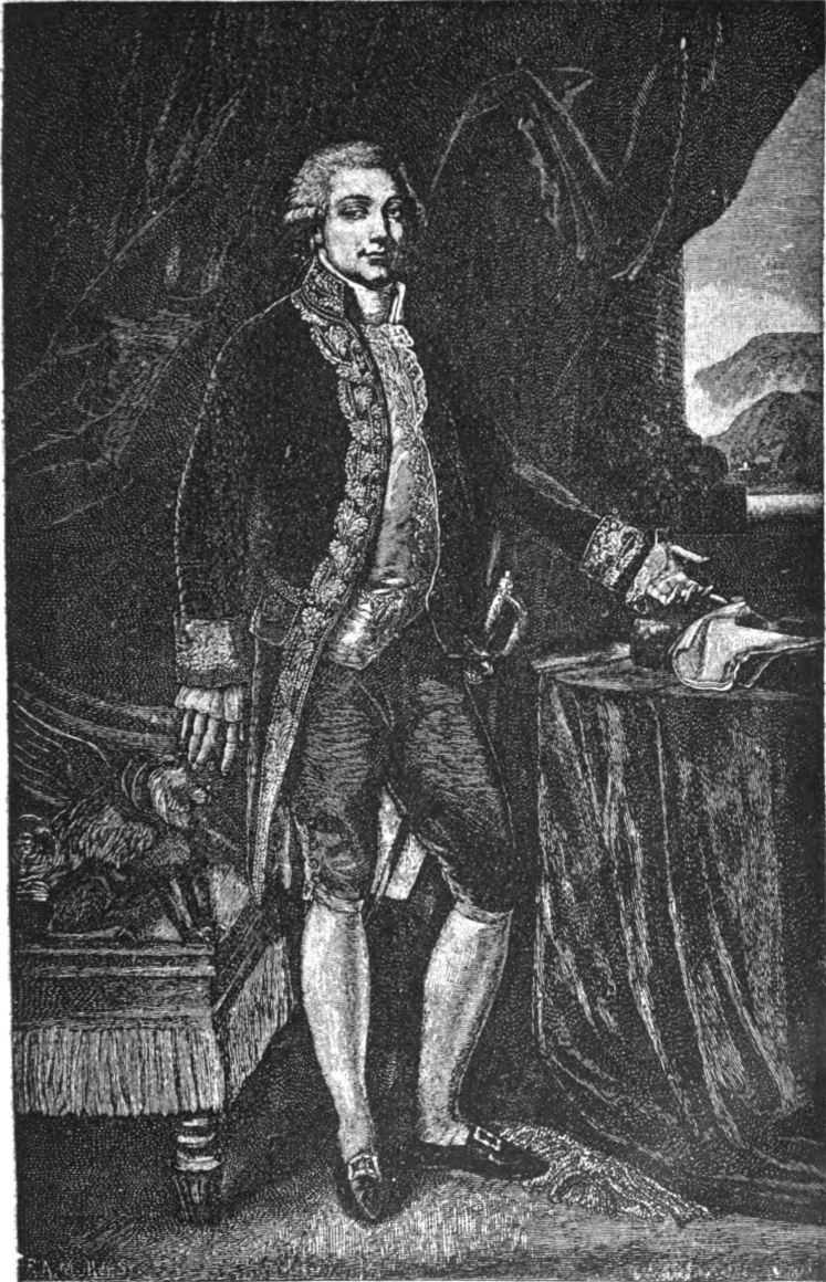
Отецъ Наполеона, Карло Буонапарте. (Оригиналъ, писанный Жироде, въ городской ратушѣ Аяччіо).

хватать, рассчитывая облегчить себѣ такимъ путемъ управление безпокойнымъ народомъ. При всемъ томъ корсиканецъ, съ чисто