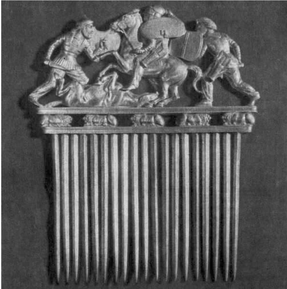
Золотой гребень из скифского кургана Приднепровья. IV в. до н.э.

рые велел запирать, чтобы скифы не знали, как он проводит в Ольвии время. Здесь он жил как эллин: одевался в греческое платье, приносил жертвы греческим богам. Когда же Скил был посвящен в таинства вакхического бога Диониса, один из жителей города с насмешкой рассказал об этом скифам, ожидавшим своего вождя. Он тайно провел их на башню, откуда они сами увидели царя в вакхическом исступлении. После этого скифы взбунтовались, свергли Скила и сделали царем его брата. Скил был вынужден бежать за Дунай к царю фракийцев. Новый скифский царь двинулся войной на Фракию. Недалеко от Дуная сошлись войска фракийцев и скифов. Но битва не состоялась, т.к. цари договорились между собой. Скил был выдан брату-сопернику и обезглавлен. «Так оберегают скифы свои обычаи и так сурово карают тех, которые заимствуют чужое», — заключает Геродот.