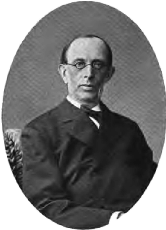
Константи́н Петро́вич Побѣдоносцевъ

Вице-Предсѣдатель Комитета по устройству Добровольнаго флота и Предсѣдатель Главнаго Управленія Общества Добровольнаго флота.