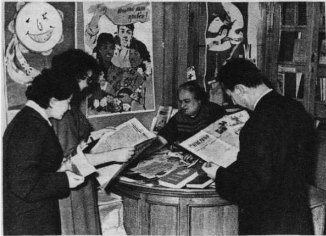
Утром, перед тем как приступить к работе, сотрудники Подготовительного комитета покупают в киоске газеты, поступающие из разных стран мира.

Москва, улица Кропоткина, 37. Здесь помещается Международный подготовительный комитет VI Всемирного фестиваля молодежи и студентов. Первое, что бросается в глаза каждому, кто входит сюда,— это своеобразный календарь: высокий щит с надписью «До фестиваля осталось...»