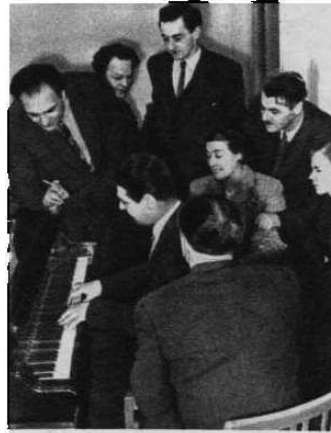
Здесь прослушивают и обсуждают новые песни.

Заглянув в одну из комнат на втором этаже, мы услышали неожиданный возглас: