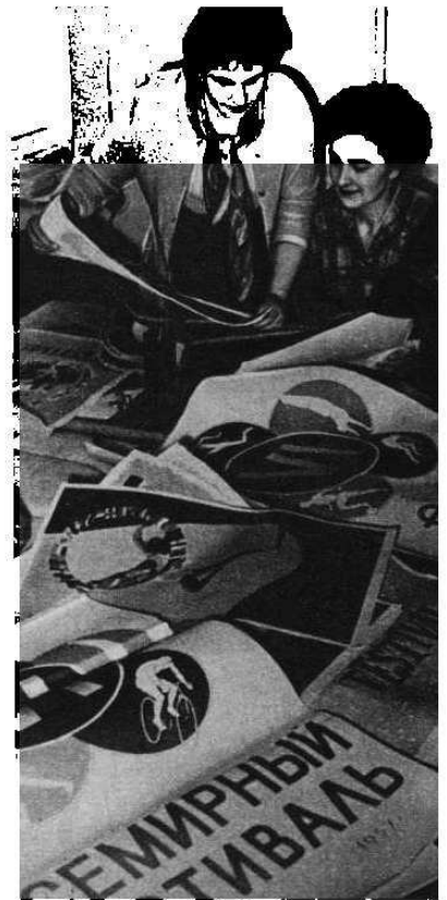
В экспедиции готовят и отправку плакаты, которые просили прислать молодежные организации, изъявившие желание участвовать в фестивале.