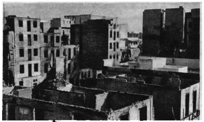
Англо-франко-израильские агрессоры зверски разрушили Порт-Саид. Так выглядела улица Шериф Аббади после бомбежки города интервентами.

Минувая зенитную батарею, мы сверачиваем вправо, в старый квартал Каира. Улочка тесная, окруженная глинобитными и кирпичными домами не выше трех этажей. Все уже и уже смыкают ее дома, а нижних этажах которых находятс лавочки, мастерские, харчевни. Мы идем уже посередине улицы, чтобы не задеть головами только что освешившие головыи туши. Продавщи банаков, цветной капу-