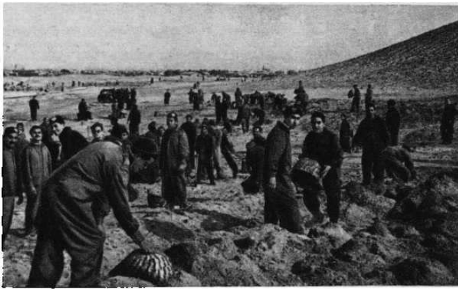
В Каире строится большой стадион. На строительную площадку приходят сотни юношей-добровольцев.