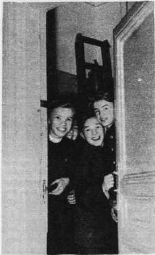
— Можно войти? Мы пришли поговорить.

Москва, улица Кропоткина, 37. Здесь помещается Международный подготовительный комитет VI Всемирного фестиваля молодежи и студентов. Первое, что бросается в глаза каждому, кто входит сюда,— это своеобразный календарь: высокий щит с надписью «До фестиваля осталось...»