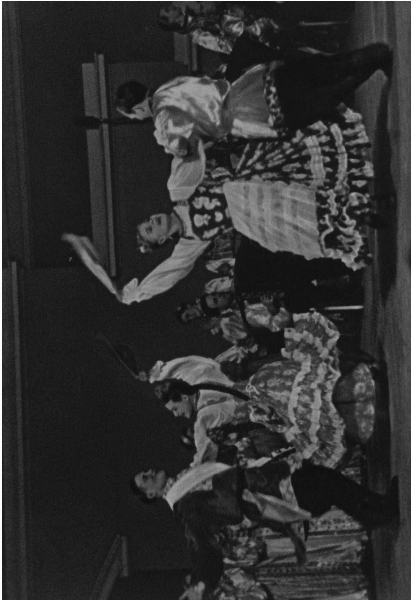
Уральский русский народный хор — наводит в участники VI Всемирного фестиваля молодежи и студентов. К предстоящему празднику юности он подготовил новую программу. На снимке: танцевальная группа хора исполняет переплыв «Свадьба».